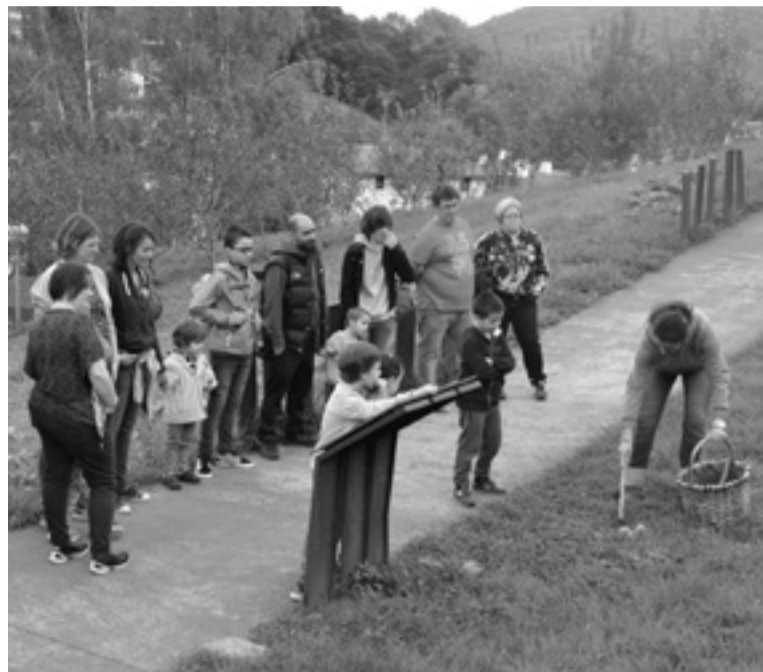
Joan den urtean ere egin zuten bisita gidatua, Sagardoetxean.

Egiteko ugari, azken egunetan Igandeen, irailaren 27an, sagar muztioaren elaborazio lanak familian egiteaz gain, helduentzako kirikoketa tailerra eta sagardo sagarren kata ere izango dira, Sagardoetxean. Goizeko 10:30etatik 12:30etara bitartean izango dira lehenengo bi jarduerak, eta