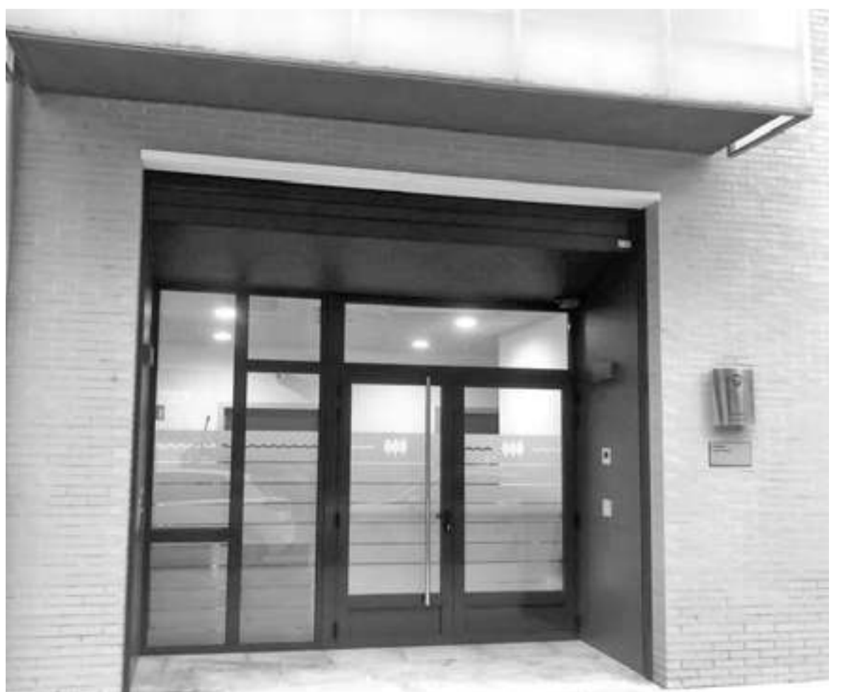
Beste zentro bat ireki du Gautenak Azpeitian.