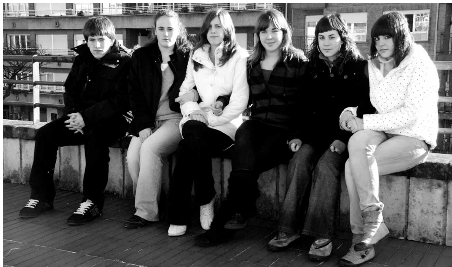
Orriaren egileak. Inmaculada ikastetxea.