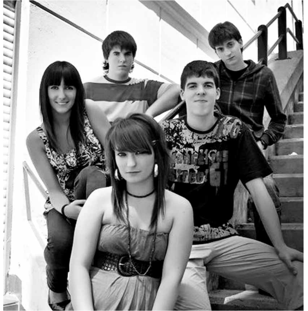
Lain taldeko kideak.

Hasiera batean Victoria Eugenia kontzertu baterako prestatu genuen, eta atzeratu zenez diskoan sartzea erabaki genuen.