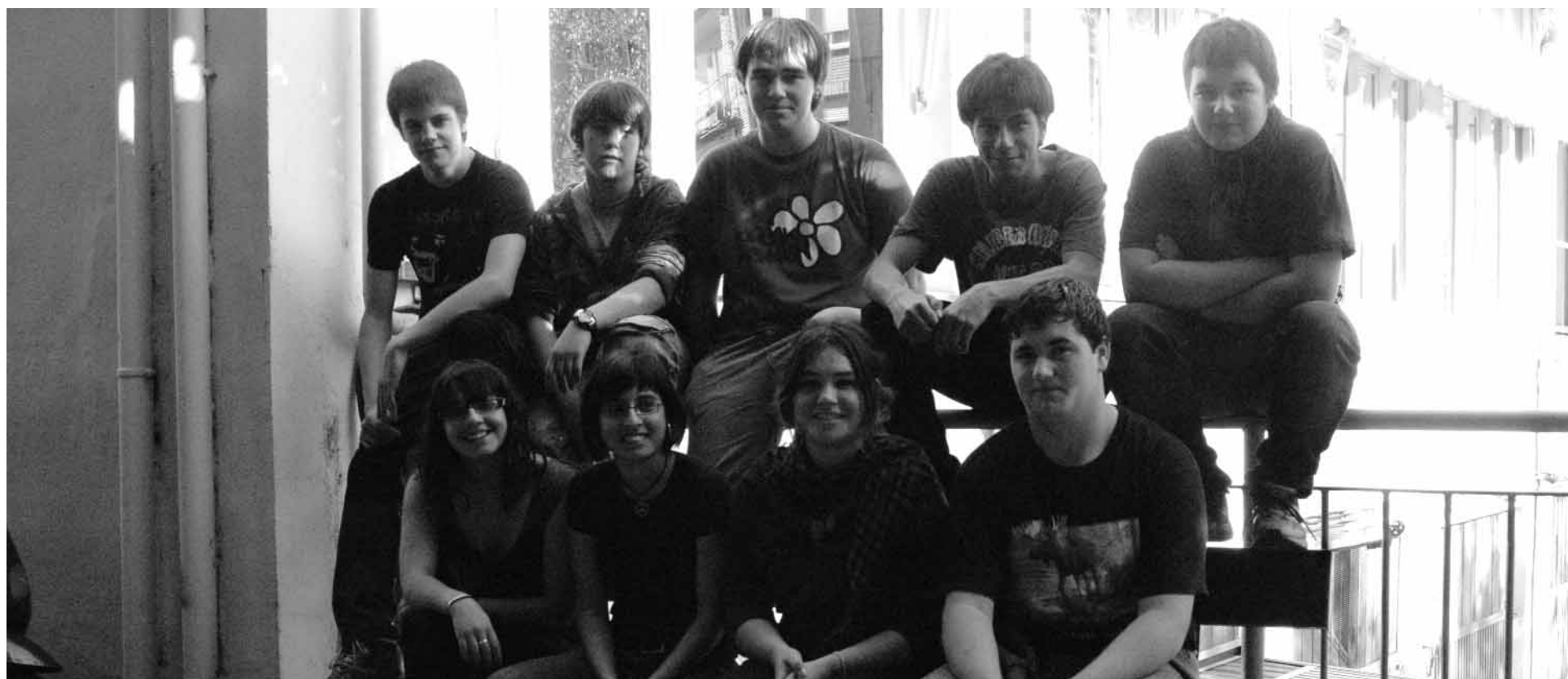
Inmaculada ikastetxeko ikasleak izan dira gaurko alearen egileak.