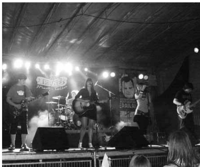
Kontzertu ugari eman dituzte urte osoan zehar.