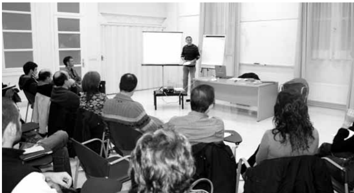
Hernani 2020 ekimeneko bilera bat, euskeraren ingurukoa.

HERRITARREK etorkizunetan nolako herria amesten duten, galdera horri erantzunez, hainbat elkarrizketa egin dira azken asteetan. Elkarrizketa horiekin bideo bat osatu dute, Hernani 2020: denon begietatik izenburua duena. Aurkezpena gaur izango da, arratsaldeko 20:00etan, Biterin, eta herritar guztiak daude gonbidatuta.