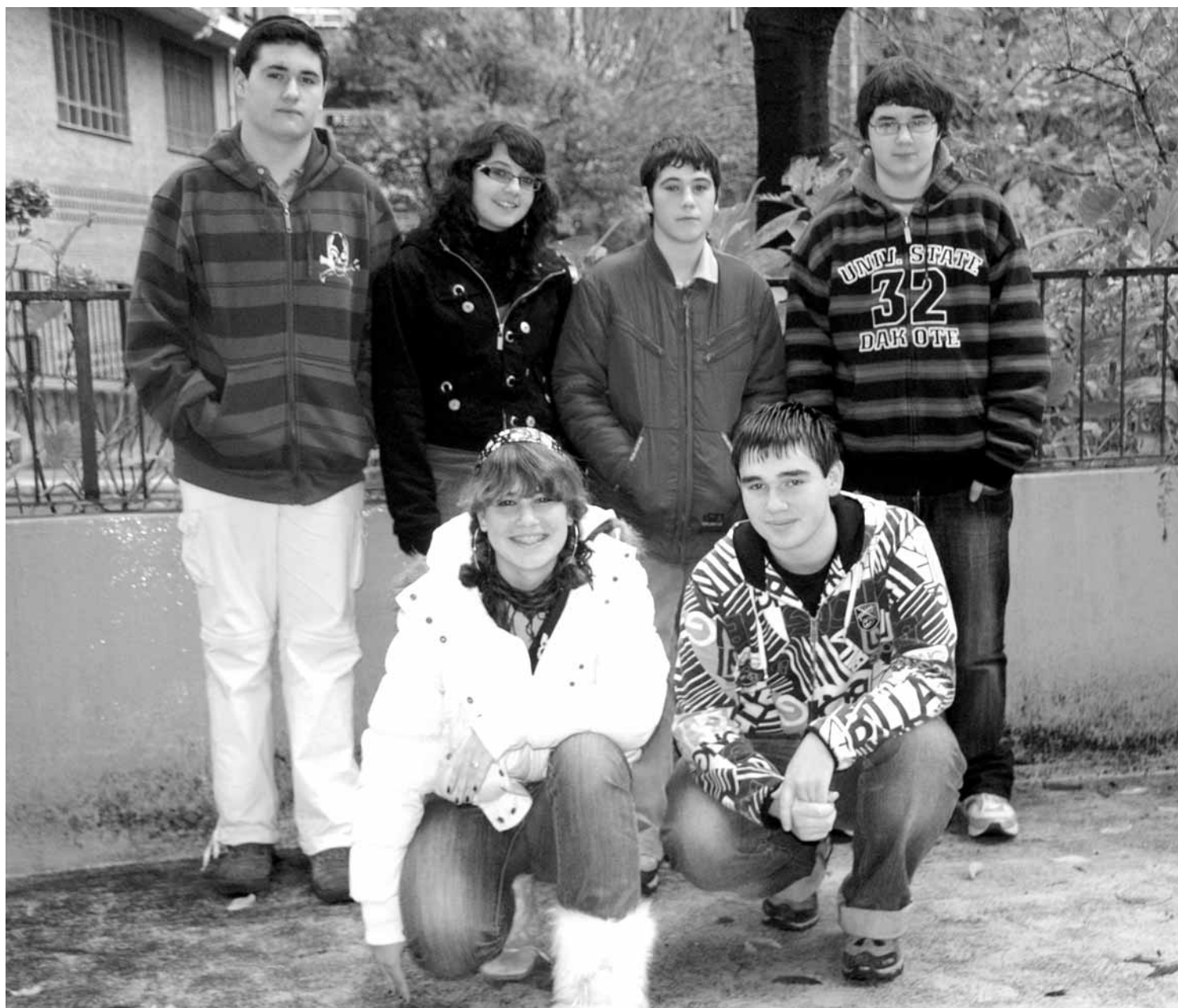
Inmaculada ikastetxeko ikasleak izan dira gaurko alearen egileak.