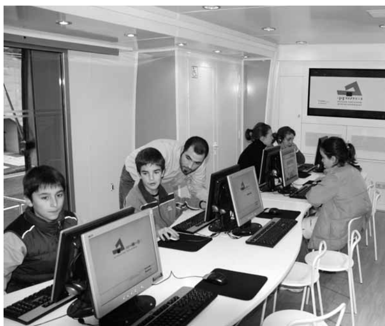
Batzar Nagusien berri ematen duen autobusa duela gutxi izan da Hernanin.

Batzarrak Ermandadeko kideek egiten zituzten bilerak ziren. Batzar hauek XIV. mendean sortu ziren noblei