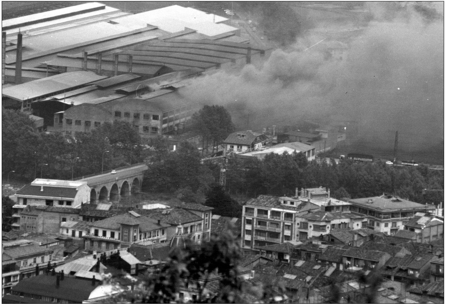
Orbegozo lantegia, martxan zegoen garaian.

Garai hartan ohikoa zen seme-alabak aitak lan egiten zuten lantokian lanean hastea. Hamalau urte ingururekin hasten ziren lanean. Mutilak normalean EPO-ra joaten ziren. Neskentzako apenas zegoen eskaintzarik. Izan ere, emakumeak lantegietan kualifikaziorik gabeko lanetara