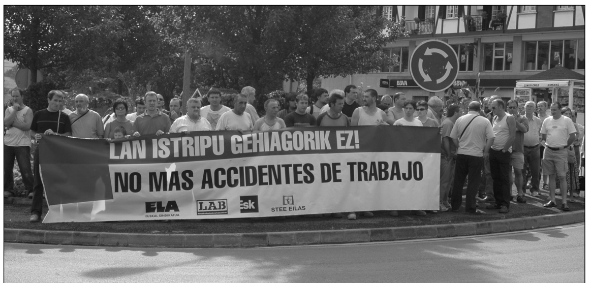
Goian 1984 urtean Orbegozoko langileen protesta, behean aurrean lan istripuen aurkako protesta.