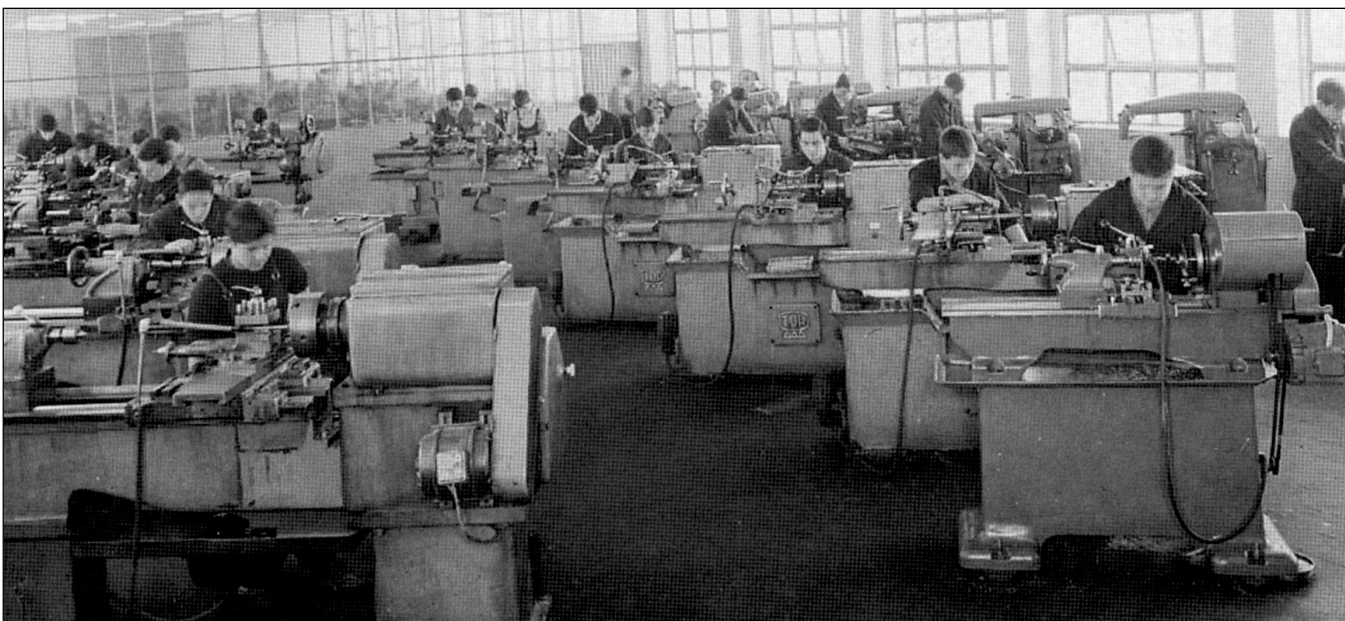
EPO ikastetxea, tailerreko klase batean.

Bigarren sektorea ahultzearekin batera etorri da hirugarren sektorearen, hau da, zerbitzu sektorearen garrantzia areagotzea. Kapitalismo bortitzak eta ekonomia globalizatzeak, enpresen deslokalizazioa eragin du besteak beste, eta honek lan merkatuak egonkortasuna galtzea ekarri du. Merkatuen desegonkortasun honen ondorio lazgarriena bat dugu gure gizartean jasaten dugun egiturazko langabezia.