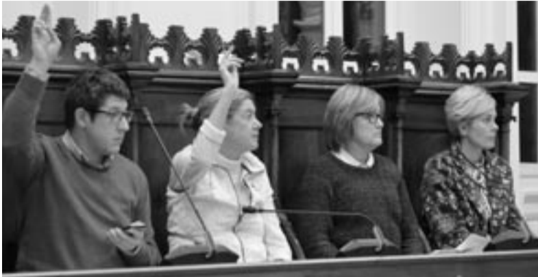
Bi mozioak onartu ziren, OHren abstentzioa eta gainontzekoen aldeko botoekin.