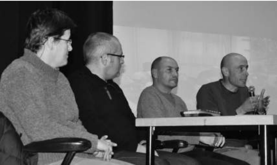
Ostiralean aurkeztu zuten kirol instalazioei buruzko parte hartze prozesua nola joan den.