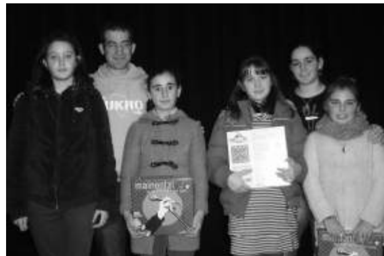
Bertsopaper sarietako irabazleak.