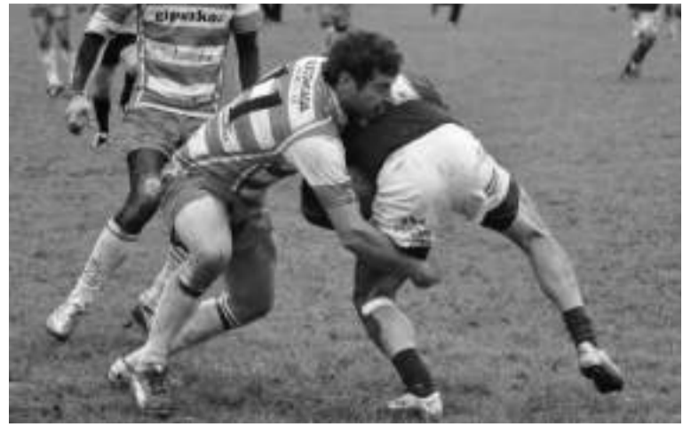
Hernanik gogor eutsi zion VRAC liderrari azken arte.