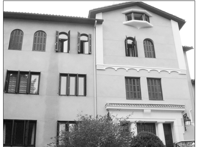
Gizakia Helburu etxea Hernanin.

Kirol honetan gero eta ehiztari gazteagoak ari dira parte hartzen. □