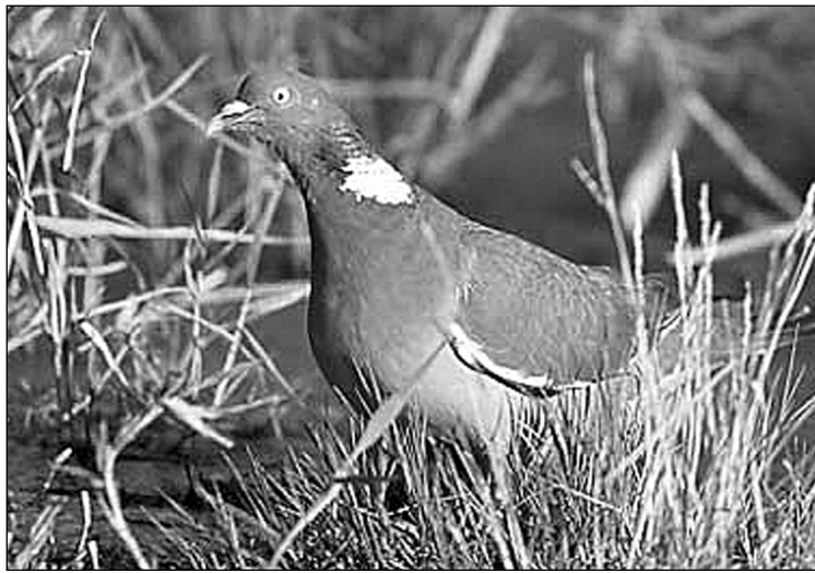
Pago-usoa. Hau da paseko usoa.