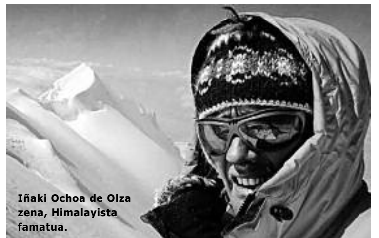
Iñaki Ochoa de Olza zena, Himalayista famatua.

tazko egoerak zein izan daitezkeen ikusteko. Lotsa edo ohitura falta superatzeko ariketak egingo dira, eta kontuan hartuko dira ostalaritzan era guztietako establezimenduak daudela: taberna, sagardotegi... ||