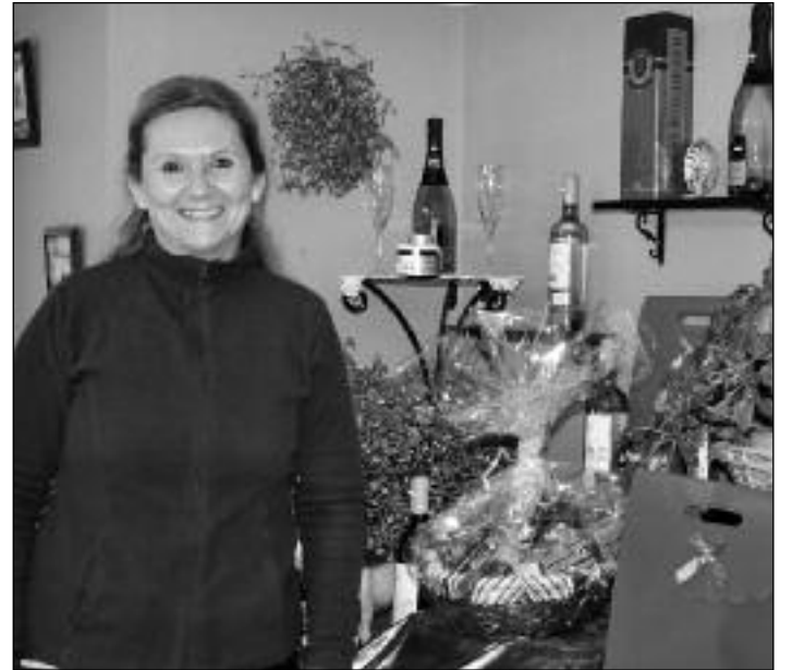
JAIONE KONGELATUAK -GABONETAN, AUKERA