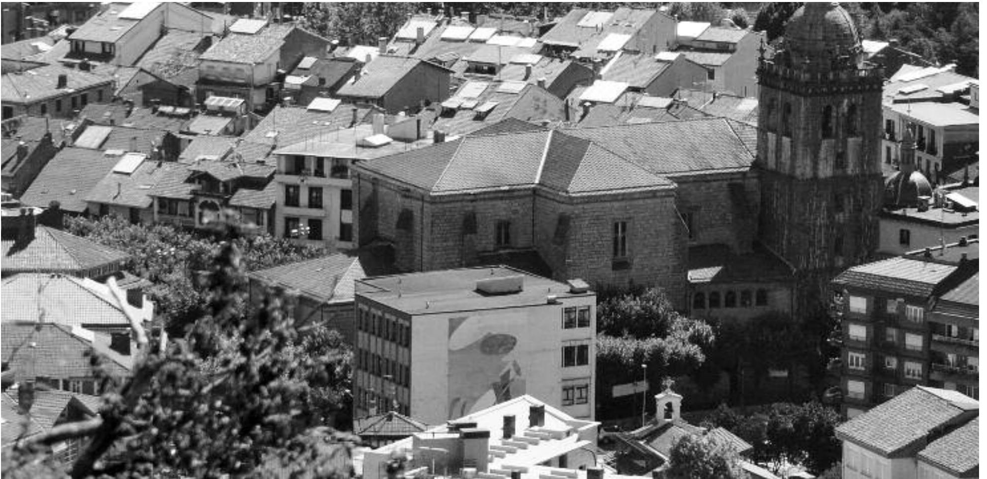
Hirigintza eta Ingurumen arloan egingo da inbertsio haundiena (906.000 euro); Urumea eraikina bota, Portu eta Karabeleko proiektua egin eta kiroldegiko teilatua egingo dira.