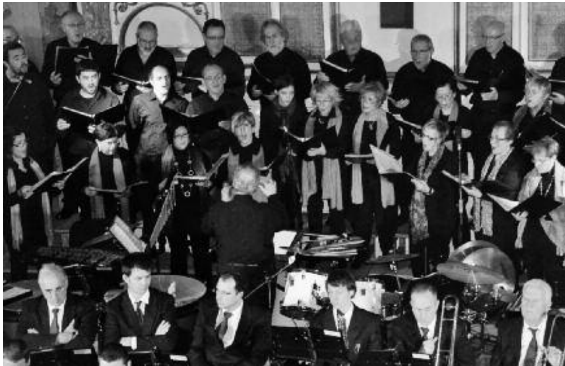
Joan den urteko kontzertua, Milagrosan. Argazkian, Ozenki abesbatzako kideak kantuan.

Gabonetako doinuak izango dira denak, eta publikoak