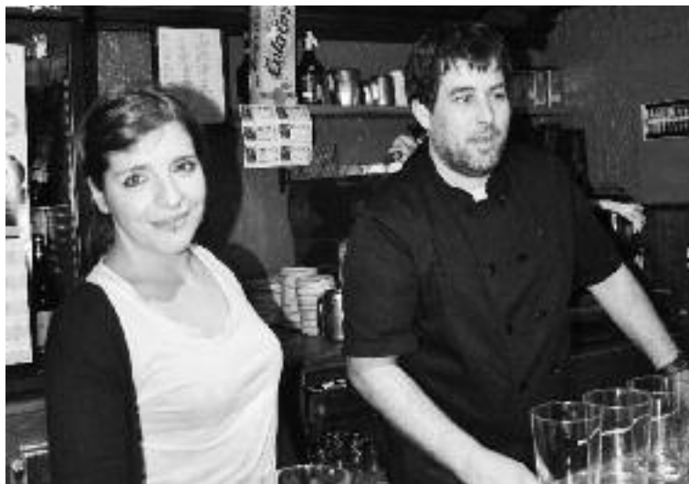
Klase praktikoa izango dira, tabernetako benetako egoerak...

Urtarrilaren 8an informatzeko bilera egingo dute Biterin, arratsaldeko 18:00etan. Urtarrilean hasiko dira kurtsoak, eta 14 saio izango dira. Apuntatzeko, deitu: 943 00 80 33 edo 645 733 818. Emaillez: ninaizgugara@gmail.com.