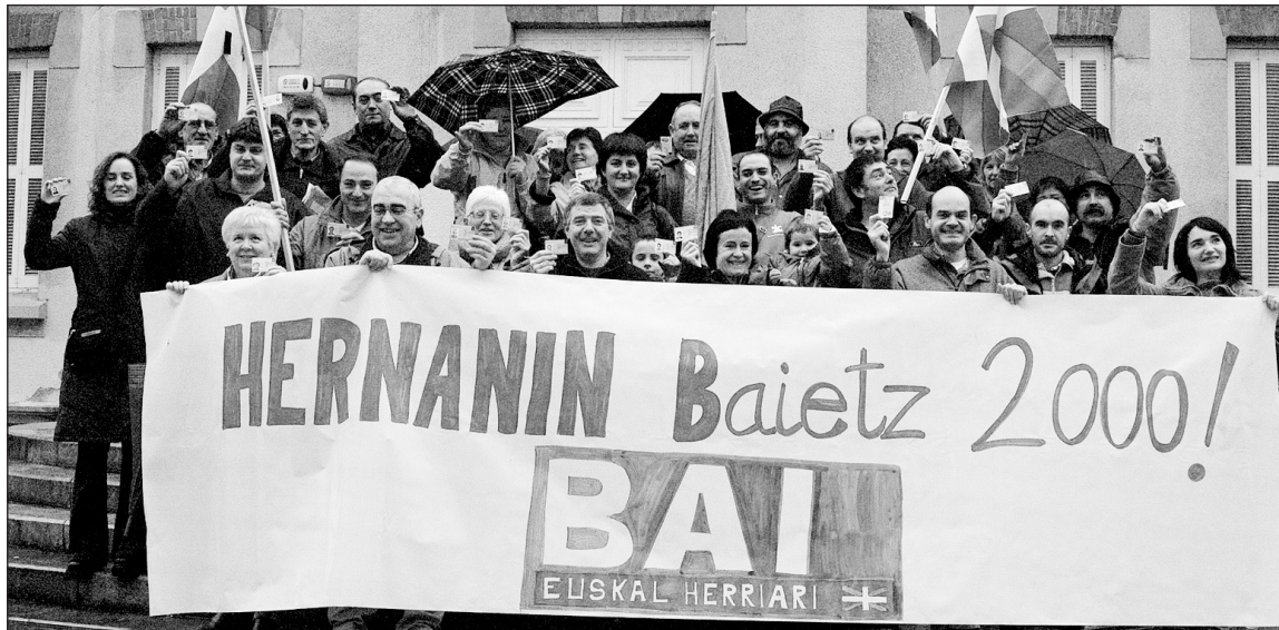
Bai Euskal Herriari ekimenari babesa eman dioten herritarrak, ekitaldi publikoan.