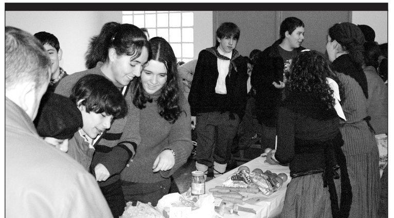
Santo Tomas eta Inmaculada ikastetxean.