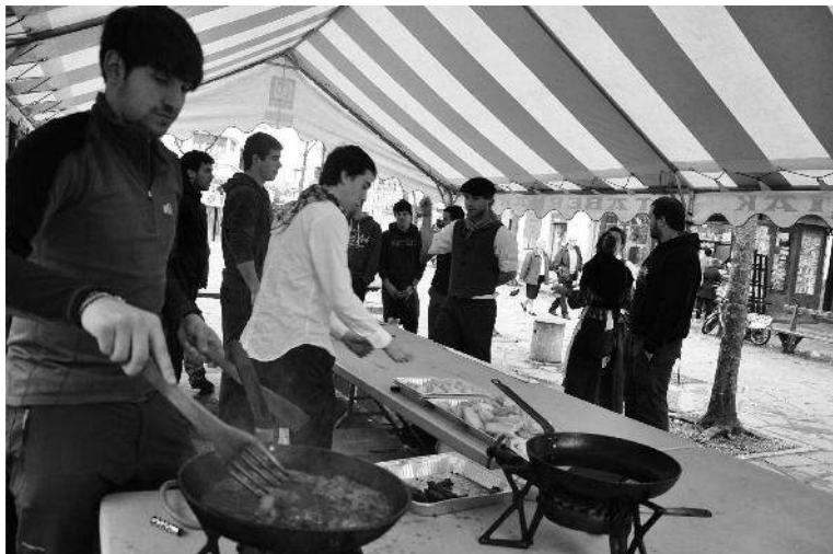
CD Hernaniko postua, Plaza Berrin.