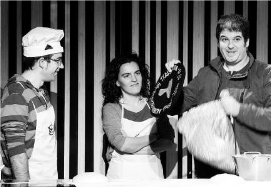
'Agñi-ano' eta Lujanbioren txapelek eman zuten zer esana.