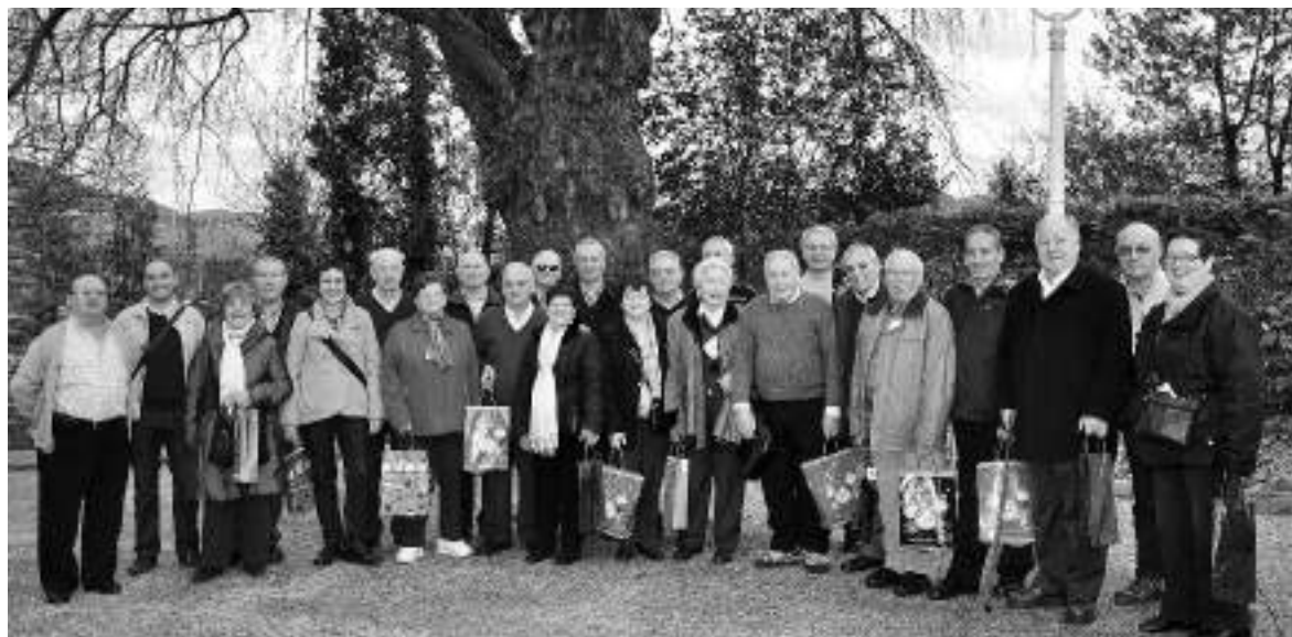
Goiz Eguzki jubilatuen etxeko irabazleak