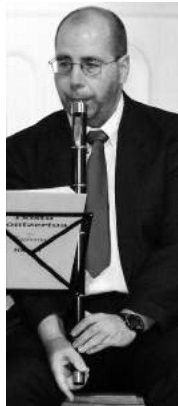
Txistulariak protagonista, gaur.

Gabon kontzertuei segida emateko, nola ez, bihar izango da talderik gehiena kalean: ikastetxe, koroak... ||