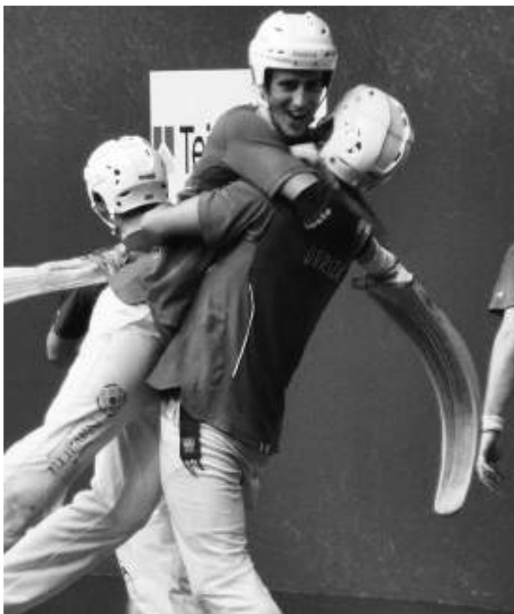
Urriza bide-lagun ezin hobea izan du Barrenetxea IVak.

«Erremontean hasitakoan helmuga bat jarria neukan buruan: binakako txapela irabaztea. Orain, atzelari gisa onenen artean kontsolidatu nahiko nuke»