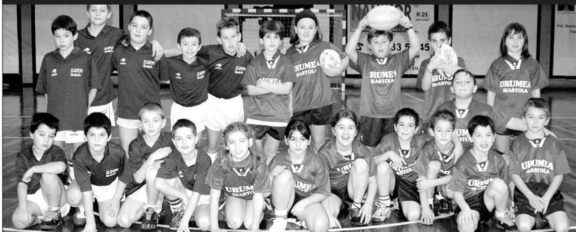
Eskola Kiroleko umeak joan den larunbatean kiroldegian.