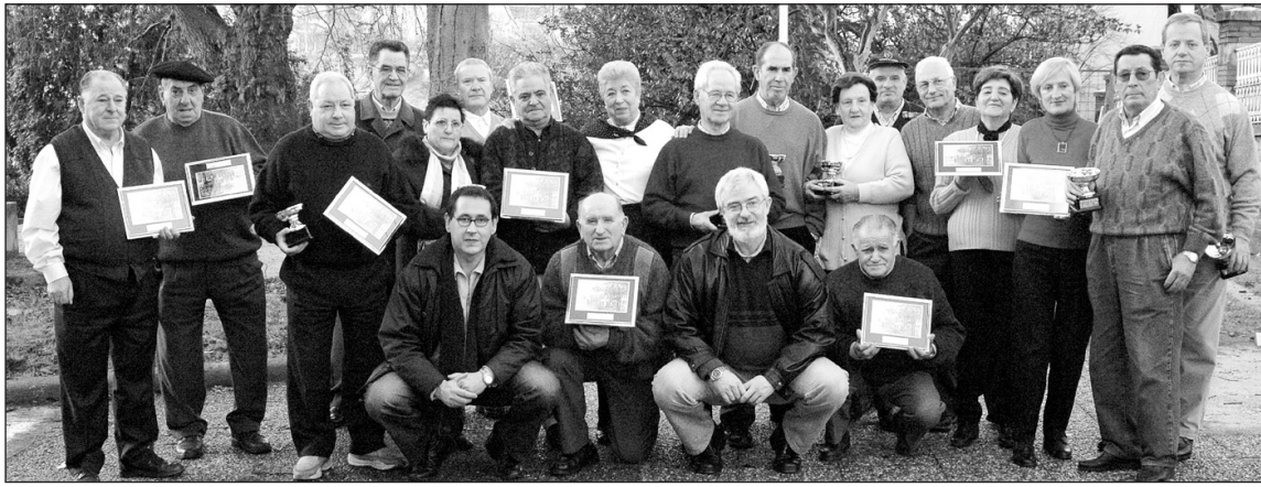
Jubilatu Etxeko txapelketetako sarituak astearteko ekitaldian, udal ordezkariekin batean.