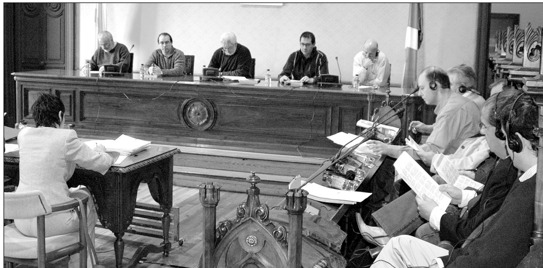
PP eta PSE-EEko zinegotziak eta Gobernu taldeko zenbait zinegotzi atzoko plenoan.

2005eko udal aurrekontu proiektua onartu zuen atzo Plenoak, Gobernu Taldea osatzen duten hiru alderdietako zinegotzien aldeko botoekin (EA, EAJ eta EB). PSE-EE abstenitu egin zen eta PPK kontra bozkatu zuen. BH lege kanporatutako plataformako kideak ere izan ziren Plenoan eta udal aurrekontuarekin ados ez zeudela azaldu zuten. Udalak berak 21.507.353 euroko aurrekontua du 2005erako. Kirol Patronatuak 1.434.351 eurokoa eta Ongintza Patronatuak 5.582.654 eurokoa.