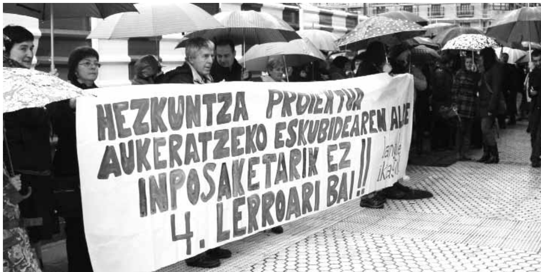
Langile Ikastolako guraso eta irakasle mordoak bildu zen asteazkenean, Hezkuntza Sailaren aurrean.

HEZKUNTZA Departamendua zenbait erabaki hartzen ari da Hernaniko ikastetxeen inguruan, hala nola, DBHko ikastetxe guztiak fusionatzea eta Haur eta Lehen Hezkuntzan, matrikulazioa 75 ikasletara mugatzea. Erabaki horiekin desadostasuna erakutsiz, hainbat ekintza burutu ditu Langile Ikastolak. Hernanin kontzentrazioa eta sinadura bilketa egin dituzte, eta asteazkenean, Hezkuntza Departamendua Donostian duen egoitzaren aurrean bildu ziren. Langile Ikastolako 300 bat guraso eta irakasle hartu zuten parte. ||