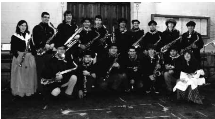
Hernasax taldea Kaxkoko kaleetan zehar ibili zen atzo.

Norbaitek diru laguntza eman nahi izanez gero, bi kontu korronte zabaldu dituzte: Kutxa, Erramun Oyarzabalen Lagun taldea - 2101.0022.04.0127112951 eta Laboralean ere bai, 3035.0026.26.0261119578. ||