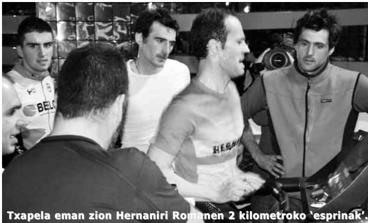
Txapela eman zion Hernaniri Romanen 2 kilometroko 'esprinak'.

Arkaitz Goñi «kalkuluak pentsatu bezala» atera zirela esan zuen, eta ez da makala, aurreko marka 12 segunduan