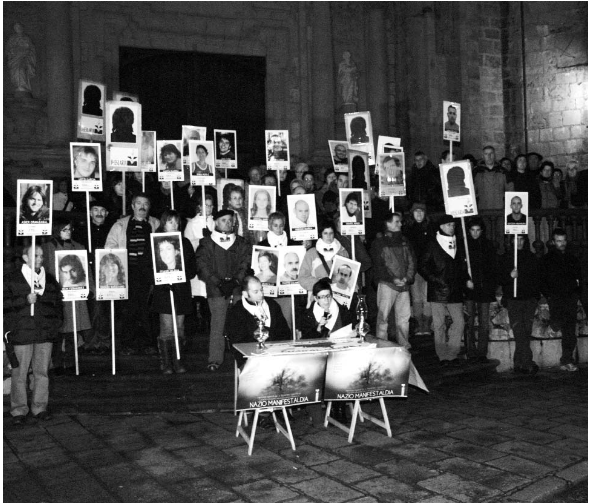
Ostiralean emandako prentsaurrekoa.

Bestalde, gaur Langraitzera martxa izango da. Autobusa goizeko 09:00etan aterako da Atsegindegitik. Abenduaren 31n, Martutenera martxa egingo dute eta goizeko 11:00etan aterako dira Astigarragatik. Arratsaldean, 19:30etan, enkartelada eta errepresaliatuen aldeko brindisa egingo dute, Plazan. ■