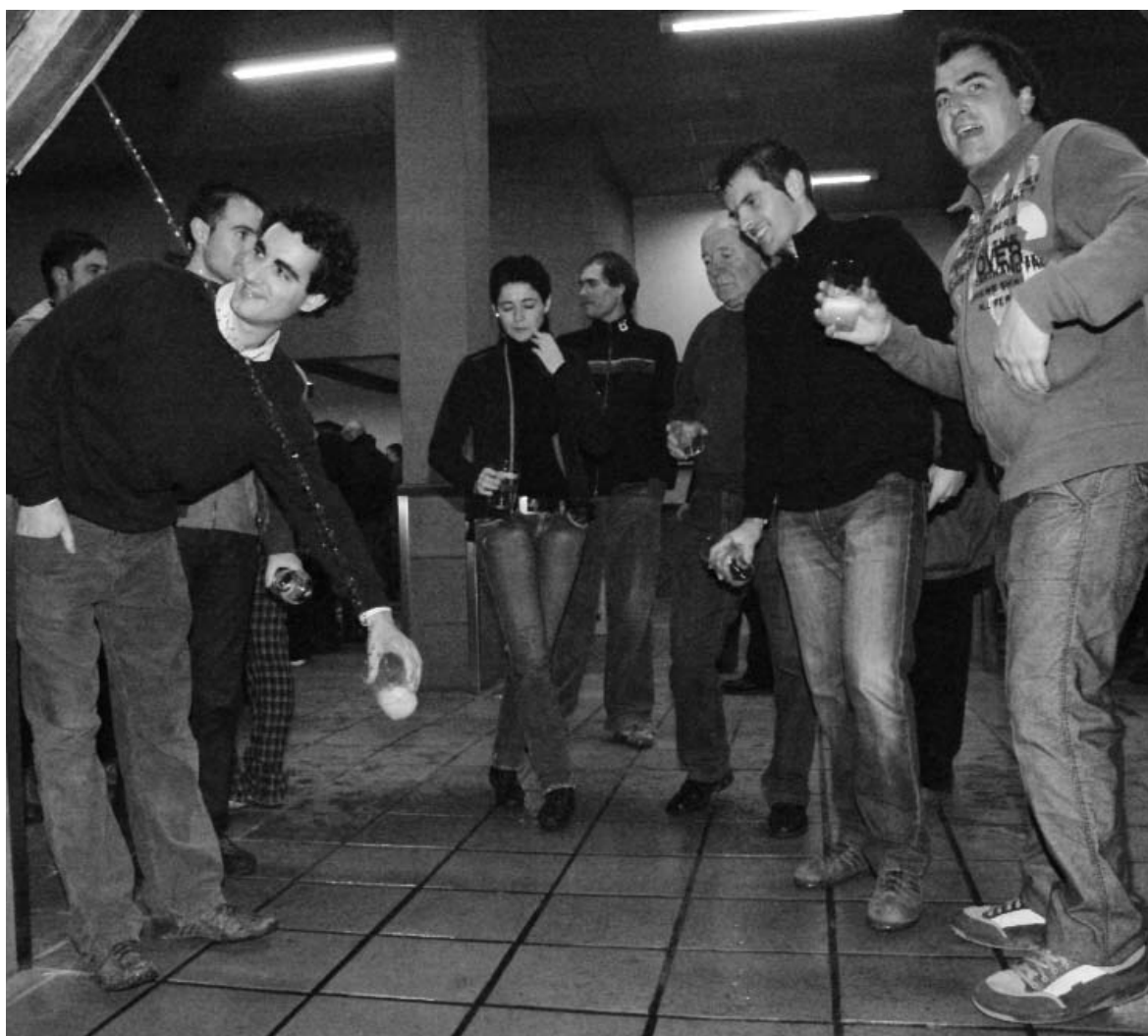
Sagardotegik herrira joatean, lasaixeago ibili beharko da datorren txotx denboraldian. (Artxiboko argazkia).

Liskarrak edo tentsio momentuak ez gertatzeko eta baretzeko lanetan aritzen dira udaltzainak. Propio, Hernanin sortzen den jende masifikazioagatik, plantila handitzen dute garai honetan. Baina aurten badago arazo bat: krisi ekonomikoa. Eusko Jaurlaritzak eta Gipuzkoako Foru Aldundiak udalteeetara bideratutako diru partida murriztu dute. Horrek esan nahi du, aurten Udalak ez duela gastu guztiak egiteko adina diru edukiko, eta udaltzaingo kopurua ezingo duela handitu sagardo denboraldirako.