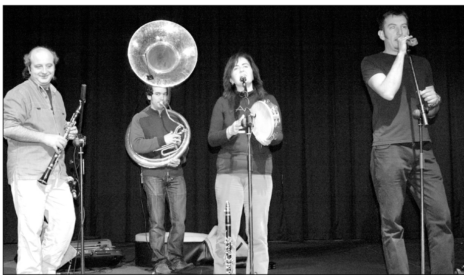
Karidadeko Benta taldeko kideak Biteriko areto nagusian.

Gaur, osteguna, bertso-jarri-afaria izango da Zumardín. Bertso zahar eta berriak kantatuz girotuko dute. Txartelak bukatu dira. □