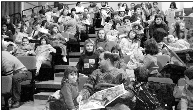
Guztira 500 bat haur eta guraso izan dira filmea ikusten.

BAI Euskarari ekimenak antolatuta Ilargiaren Sekretua euskerazko pelikula ikusteko aukera izan da aste honetan. Beste artisten artean, Takolo, Pirritx eta Porrotx protagonista dituen pelikula honen 3 saio egin dituzte eta guztira 500 bat haur eta gurasok ikusi dute. □