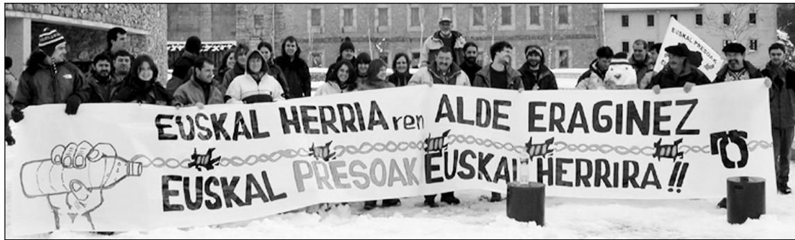
Guztira 40 bat gipuzkoar daude Arantzazun gose greban, hilaren 26an hasi eta ostirala arte izango dira.

Jaurlaritzaren Estatutu proposamena gaur botatuko dute Legebiltzarrean, eta aurrera egiteko gehingo osoa behar du, 38 boto. Oraingoz EA, EAJ eta EBren aldeko botoak ditu, 36, eta EBk zehaztu du bere botoaren zentzua ez dela plana onartzea, tramitazioan aurrera egiteko bidea ematea baizik. SA komisioan abstenitu egin zen. PP eta PSE-EEK kontrako botoa iragarri dute. □