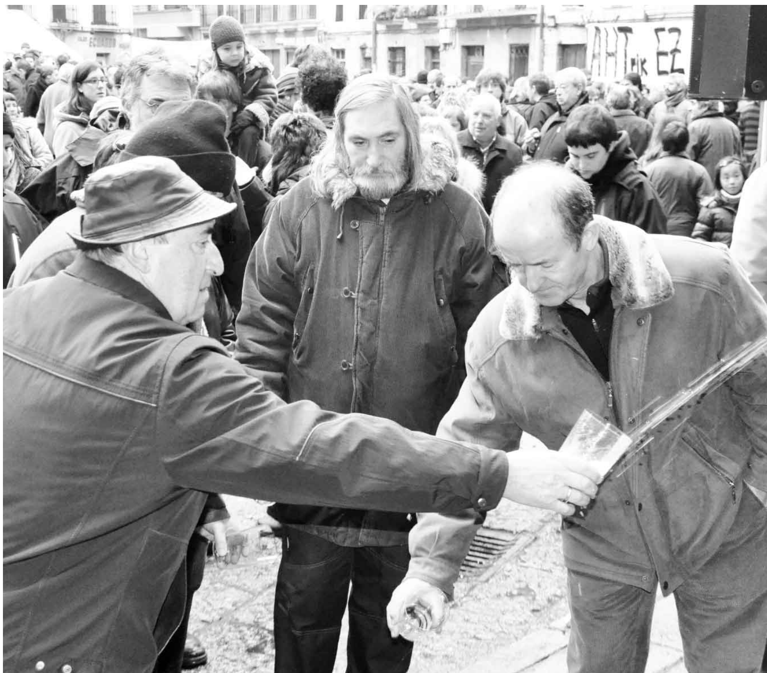
Txotx irekiera eguna, urtarrilaren 22an izango da. Urtero bezala, denboraldiko sagardoa probatzeko aukera izango da Plazan.

Hilabetero bezala, datorren honetan ere ez dira faltako erakusketak. Hain zuzen, bi era-