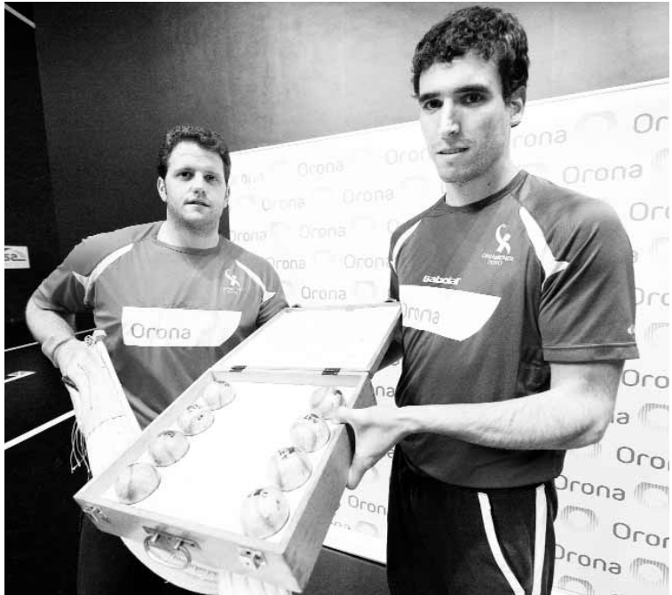
Urrutia I eta Urriza gustora geratu ziren aukeratutako materialarekin.

Urriza eta Urrutia finalerdia iritsi dira, Zeberio eta San Migueli erraz irabazi ostean, eta partidu parekatua espero da gaur. Urrutiak sakez min egiten badaki eta Urriza eusten saiatuko da. ||