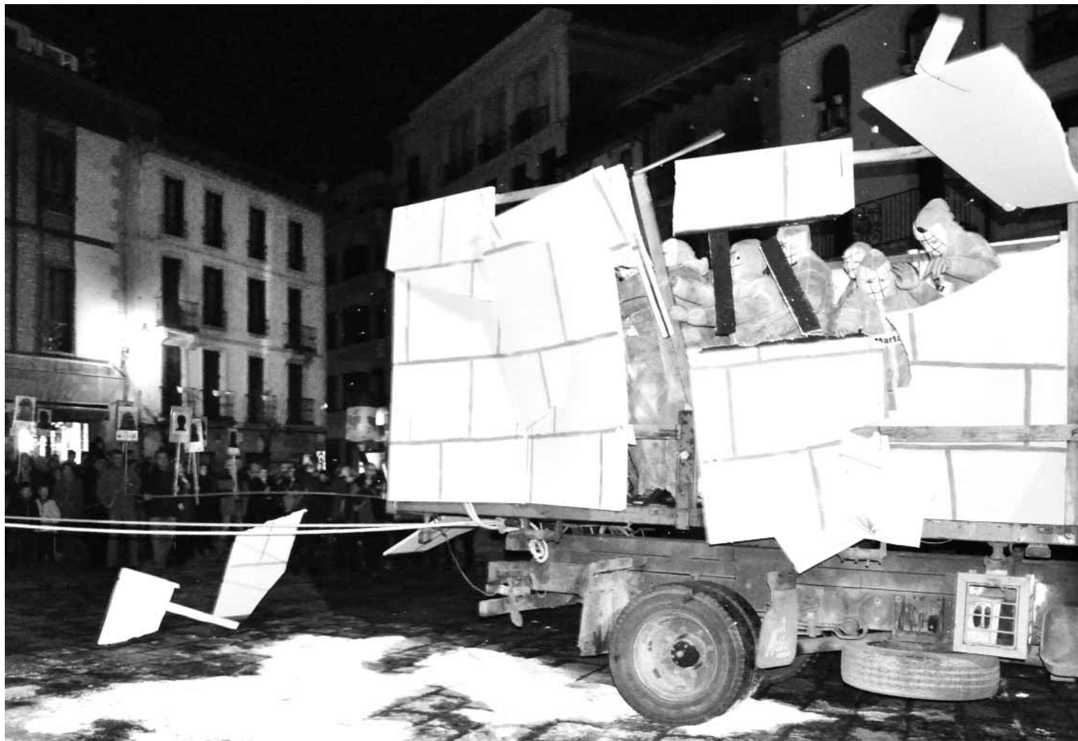
Lau zutabetan banatuta, preso eta iheslarien aldeko kalejirak egin ziren atzo, herrian barrena. Elkartu ostean, antzerkia egin zuten Plazan.