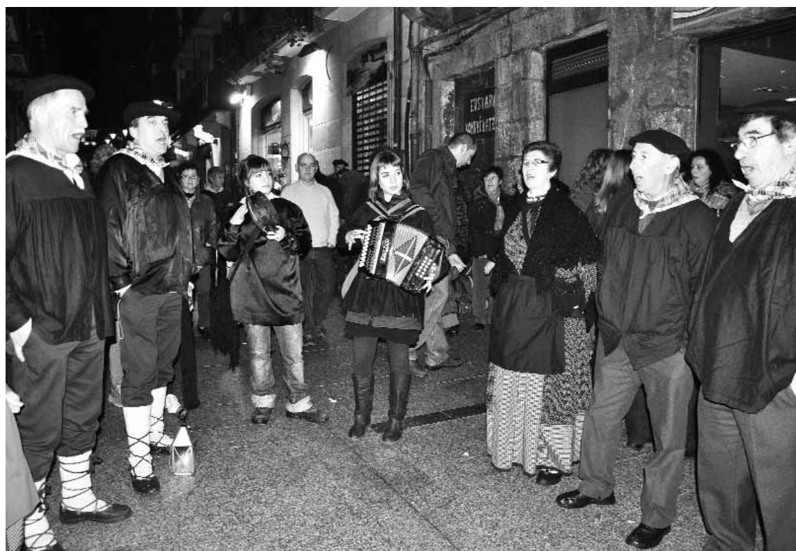
Ohitura Zaharrak abesbatzako kideak geldialdi seinalatua izaten dute Irizar taberna aurrean.

Molotoff irratiak hasi ditu saio berriak, eta udara bitarte, musika saioak, irratsaioak, Info7ko albistegia, magazinak eta abar izango dira. Irratiak diru pixka bat ateratzeko egin ohi du urtero mariskada haundi hau, eta gaurko eguna aprobetxatuko dute, urtero dirua ematen duten irrati-zaleei eskerrak emateko ere.