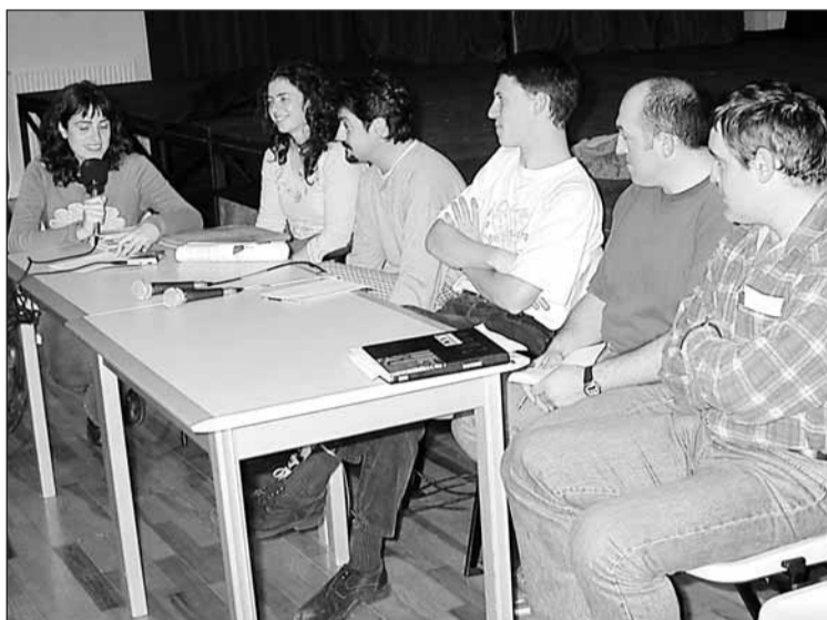
Hizlariak eta moderatzailea, Biteriko areto nagusian.