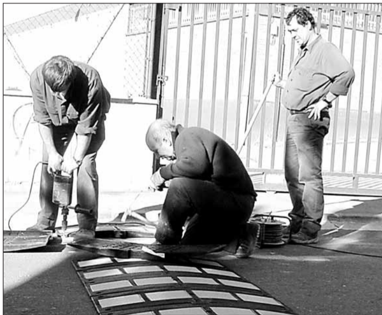
Badenak jartzen ari den hirukoa; bakoitza bere lanean.

Beraz badakizue, kontuz ibili Hernanin barrena; fitipaldiak bereziki.