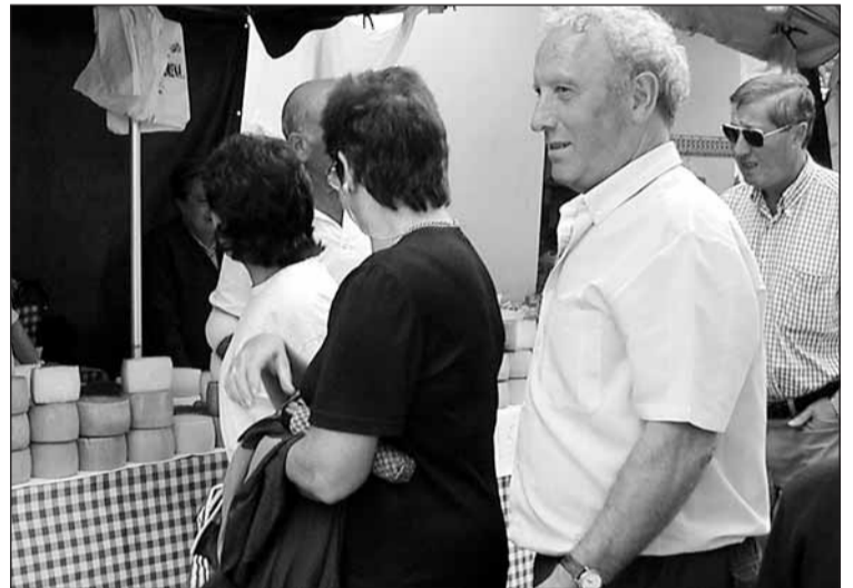
Gazta erosten batzuek, eta besteak erosi edo ez pentsatzen.

■ Inguruko dozena bat herrietako baserriko produktak saltzen dira ■ Goizetik eguerdira arte izangoda.