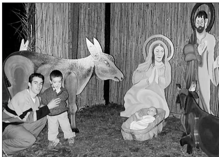
Karabelgo aita semeak, Jesusen jaiotzan.