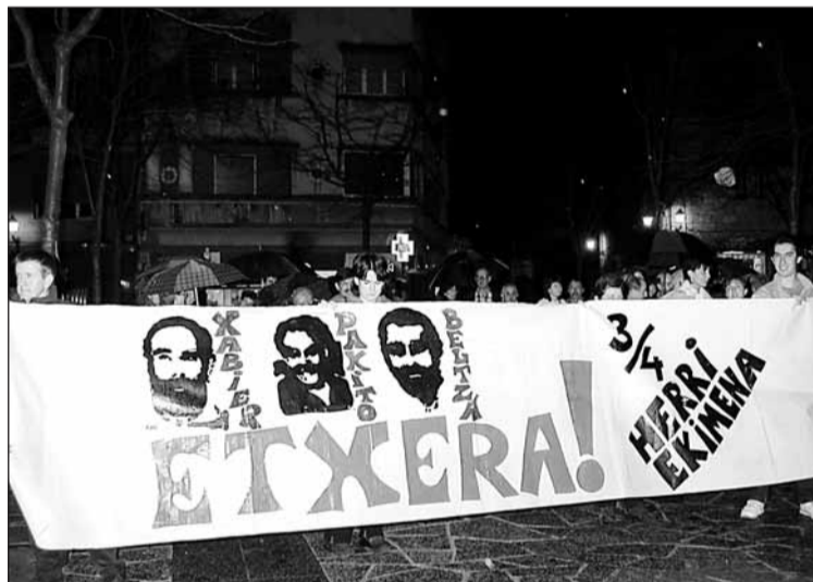
Hegohaizen ondorengo euripean egin zen atzo inulabarreko kontzentrazioa.