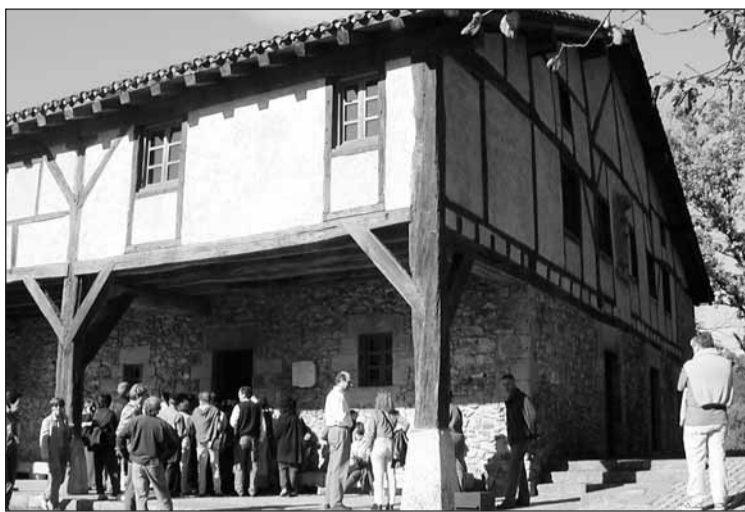
Jendearen emanak aparkaleku gehiago eskatzen du Txilidalekun.