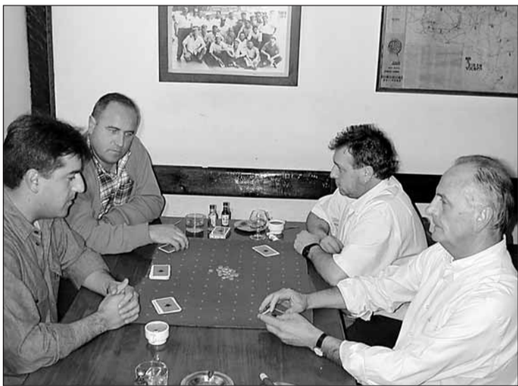
Asteartean Elur Txorin; ez zen bromarik gero!

■ Bikoteka 36 apuntatu dira eta buruz buru 22 ■ Gaur ere partidak jokatuko dira.