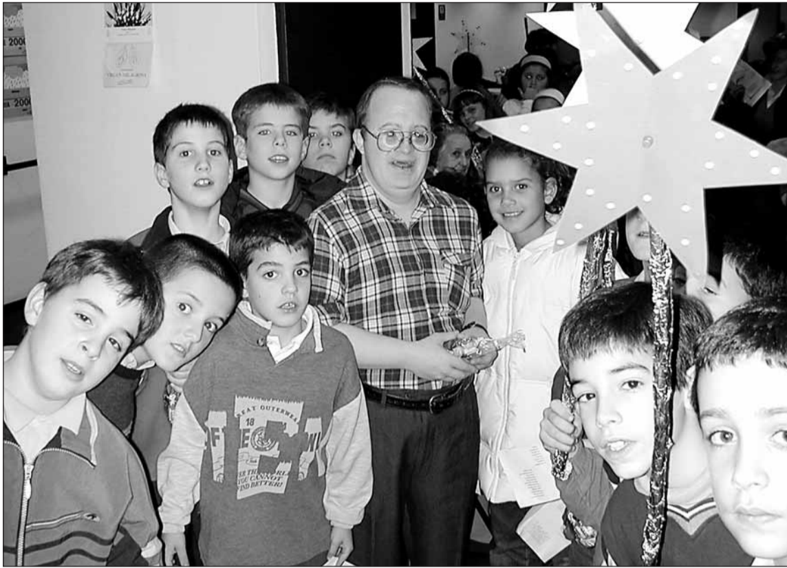
Umeak opariak banatu zituzten; Olentzerori aurea hartuta.

■ 'Fidatzea' ren gaia bukatzeko egin zuten katekesiko 4garren mailako umeek.