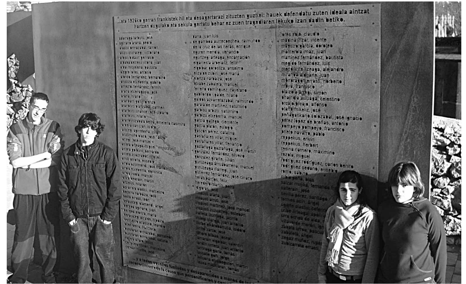
Inmaculada ikastetxeko gazteak, 36ko gerran fusilatu zituztenen omenez jarri duten eskulturaren ondoan.

Bitartean Hernani eta inguruko boluntarioz osatutako taldeak, mikeleteekin batera, defentsa antolatu eta ehiza eskopetekin mendi aldera jo zuten. Sozialistak, komunistak, errepublikarrak eta abertzaleak elkarrekin aritu ziren. Buruzagi jeltzaleek mobilizazioarako deialdia abuztu erdialdean egin bazuten ere, EAJko hainbat militanteek bat egin