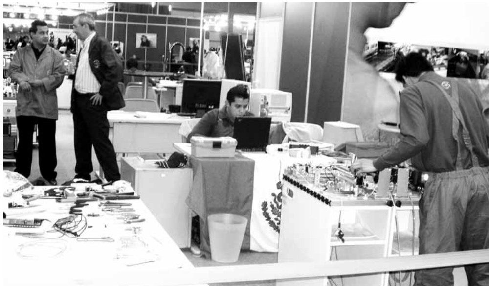
Elektronikako postuak arrakasta handia izan zuen

Erakusketan zeuden arloak stand-etan zeuden banatuak, arlo bakoitzean lanbide desberdinak zeudelarik. Adibidez, administrazioan: administrazio eta finantzak, administrazio kudeaketa eta