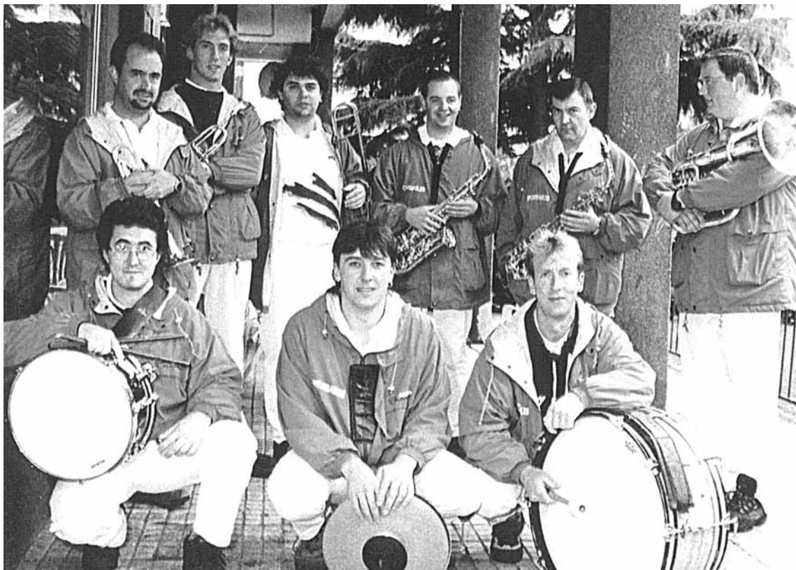
Incansables txaranga Kaxkoa girotzen ariko da gaur gauean.

Bestetik Apeadero tabernan Aritz Sound System ariko da musika beltza jartzen gau osoan zehar. Reggae, rap, funk, soul, afro-brasilardar erritmoak... entzuteko aukera izango da. Play aretoan ere Urte Zaharretako festa antolatuta dute musika jarraileekin gau osoan zehar. ||