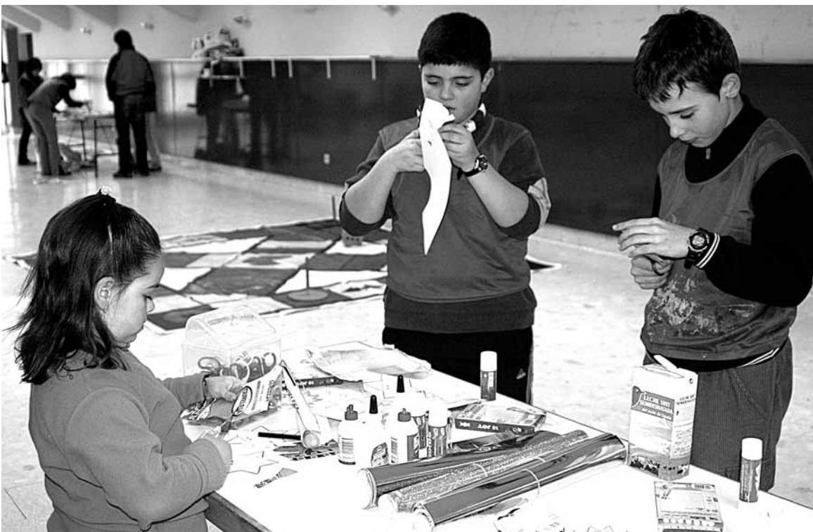
Lehen Hezkuntzako 30 bat ikasle aritu dira tribial moduko honetan jolasten.