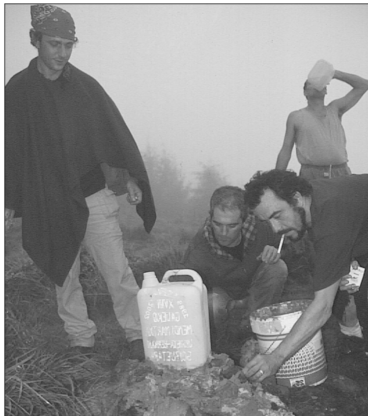
Duela hiru urteko eta iazko argazkiak, batean Goizuetara iristeko gertu eta bestean urtero eramaten duten mojito bidoiarekin eskultura egiten.