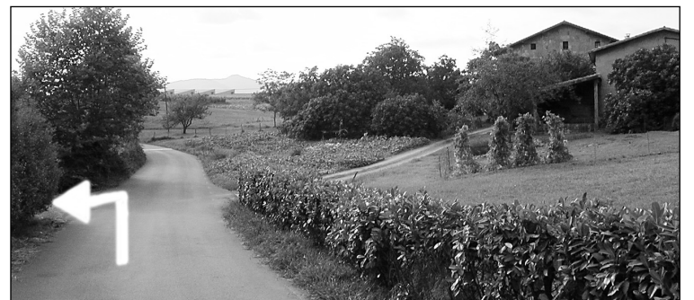
Goian, Inglesaren harria. Behean, Pittikar baserri parera iristen ezkerretara hartu beharreko bide gurutzia.