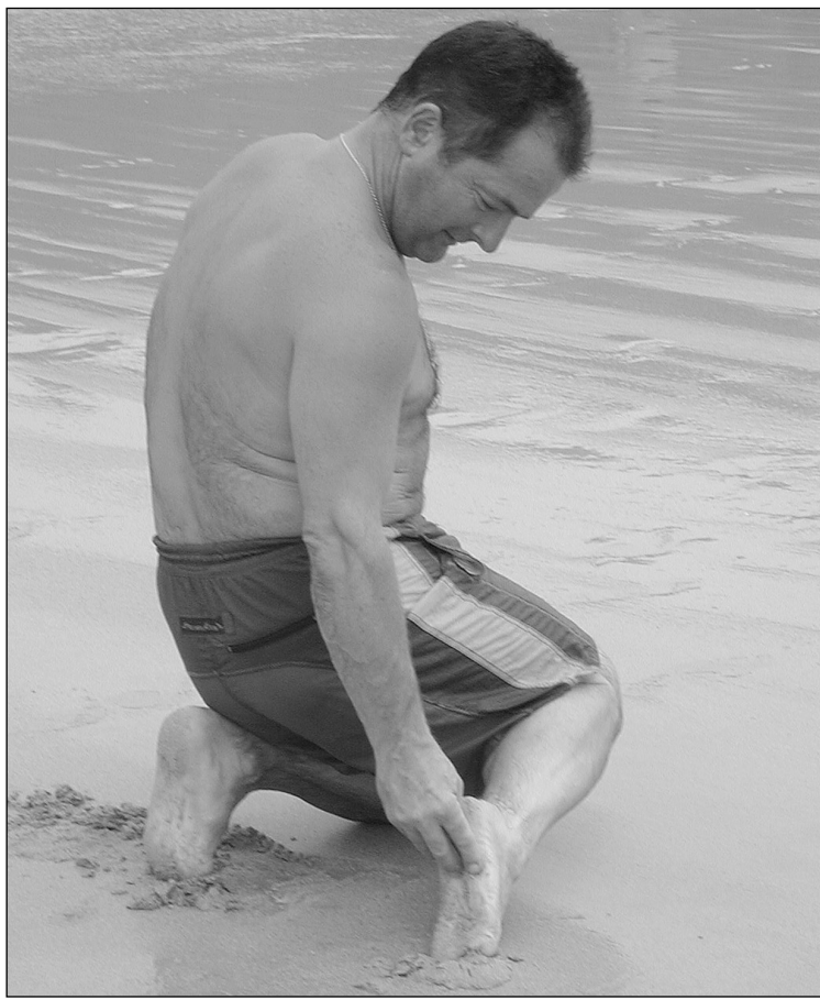
Jendea hanka azpian txapapotea ote duen begira egoten da.

Prestige ondoratu zenean Eusko Jaurlaritzak Erakunde arteko eta Sail arteko Batzordea jarri zuen martxan. Batzorde hau hondartza eta