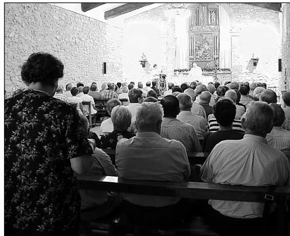
Goian, Santio Mendin soka dantzan eta erdian, Txistulariak Aranoko San Roke ermita aurrean. Behean, Aranon eta Santiomen ermita betean meza ematen.