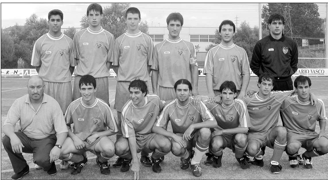
Hernaniko Gorenkoen taldeak joku ona azaldu du azken partiduan.