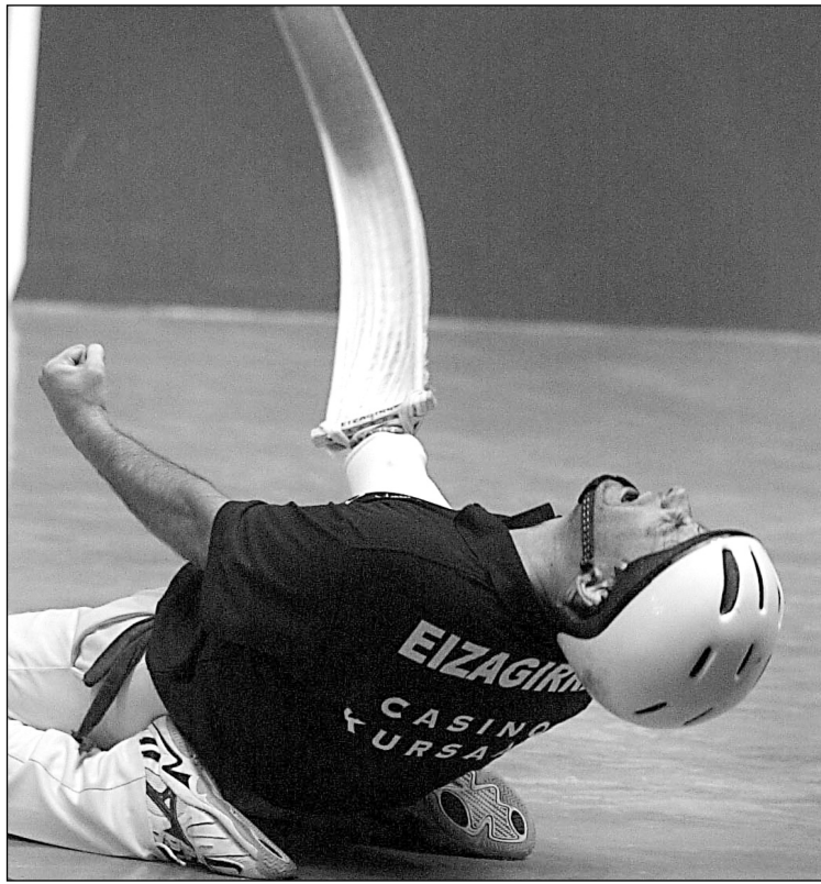
Eizagirre azken tantoa eginda.

Bestalde, jaialdiko bigarren partiduan Ezkurrak eta