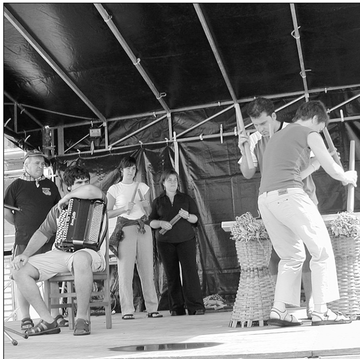
Ezkerrean, soinu jole eta txalapartariak jai hasieran. Eskubian, San Kupeltxo Ergobiko jaien 'santua'.

Altuna II-Aizpuru/Altuna I-Iriarte; Iribarren-Aizpurua II-Zeberio I-Urko; Iturralde-Etxeberria/Juaristi-Badiola. □