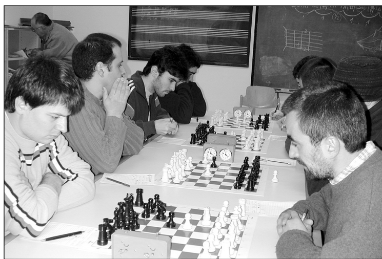
Aurten ere bi Ligan bi talde nahi ditu Xake Elkarteak.