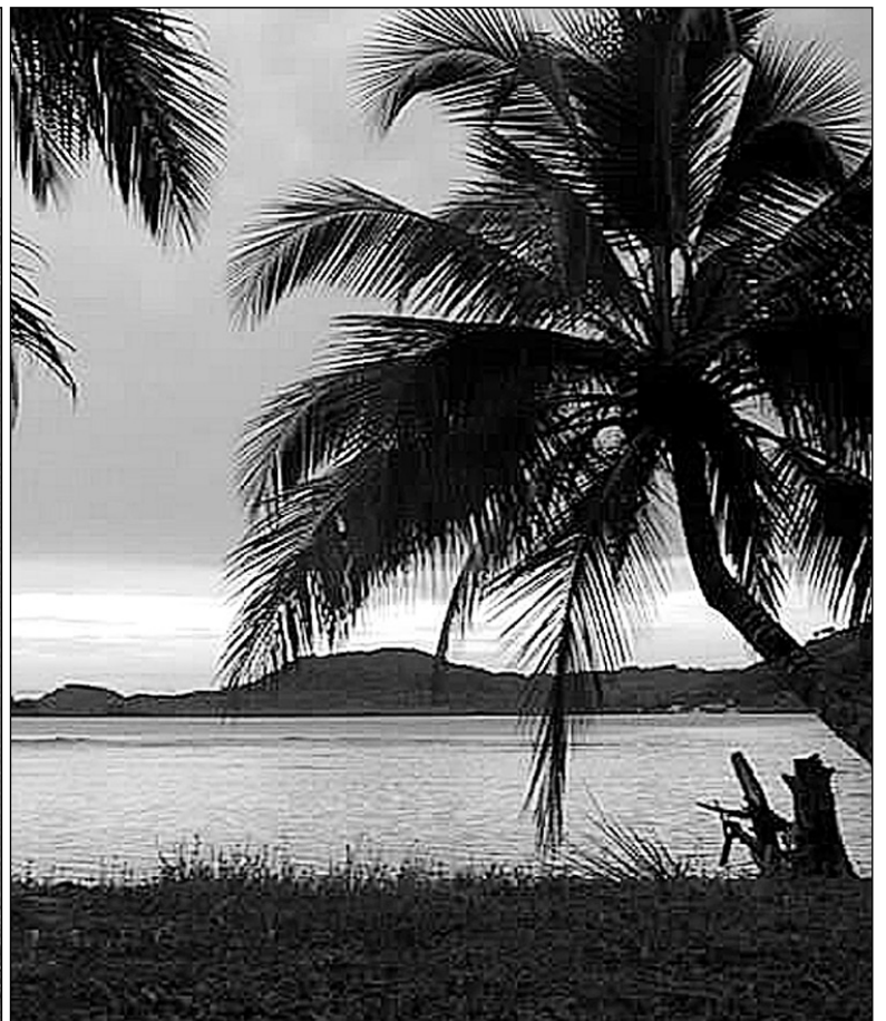
Hondartza bila Mediterraneo edo Karibe aldera joateko ofertak eskatzen dituzte hernaniarrek bidaia agentzietan.

familiak, bikote gazteak eta lagun taldeak izaten dira agentzietako klienteak. Hauek leku batetik bestera, bazter guztiak ezagutu nahian ibili baino nahiago dute deskantsurako leku bat aukeratu. Jendeak gero eta garrantzia gehiago ematen dio lekuari eta bertako zerbitzuei (garraioa, janaria, hotela, denbora libre pasatzeko lekuak...). Jendeak zerbitzu onak eta eskura daudenak bilatzen ditu ahalik eta preziorik hoberenean.