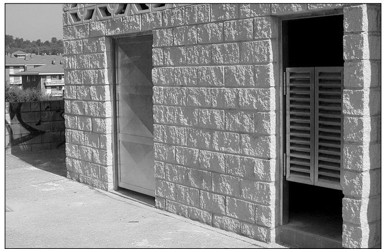
Datorren astean martxan egongo dira komunak.