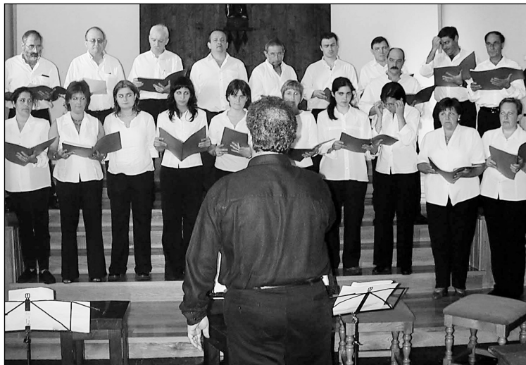
Ereñotzuko Ozenki abesbatzak 10 urte bete ditu aurten.

Aurtengoa urte berezia da Ozenki abesbatzarentzat, 10 urte bete baititu Ereñotzuko koruak. Hori dela eta, zenbait ekitaldi iragarri dituzte. □