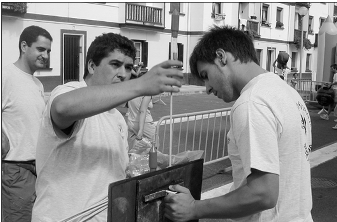
Atzo eguerdian festei hasiera emateko txupinazoa botatzen.