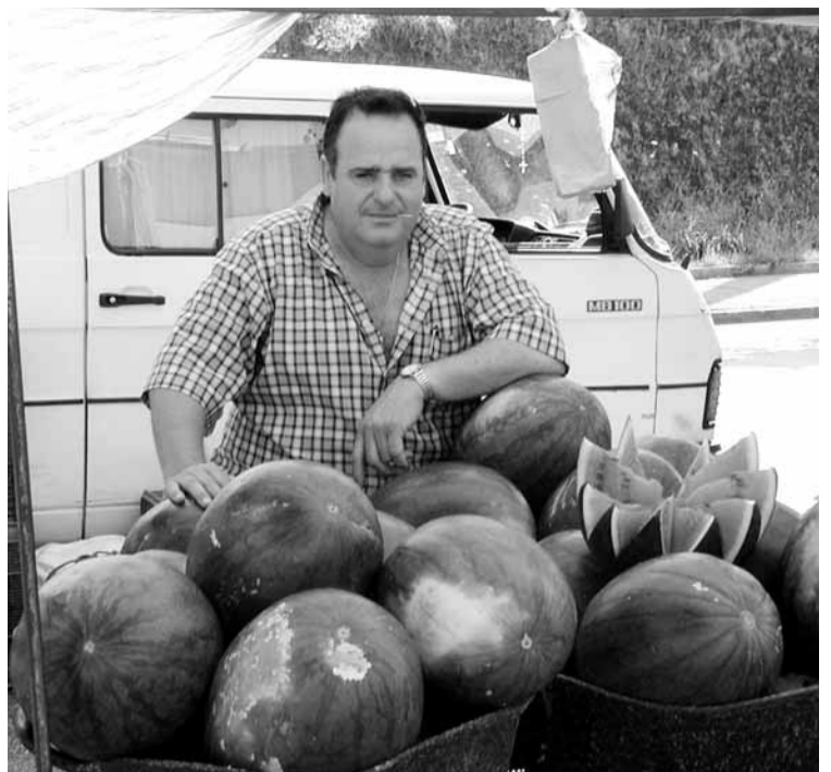
Atzoko ferian bazen jenero ederrik!