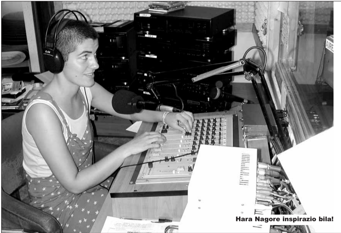
Hara Nagore inspirazio bila!

Uztailaz gero martxan da udako programazioa, eta irailean osatuko da datorren urtekoa. Bolada honetan musika ezberdinek betetzen dituzte ordurik gehienak.