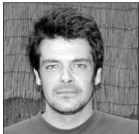
Iñigo Tolaretxipi ARIZMENDI jatetxea