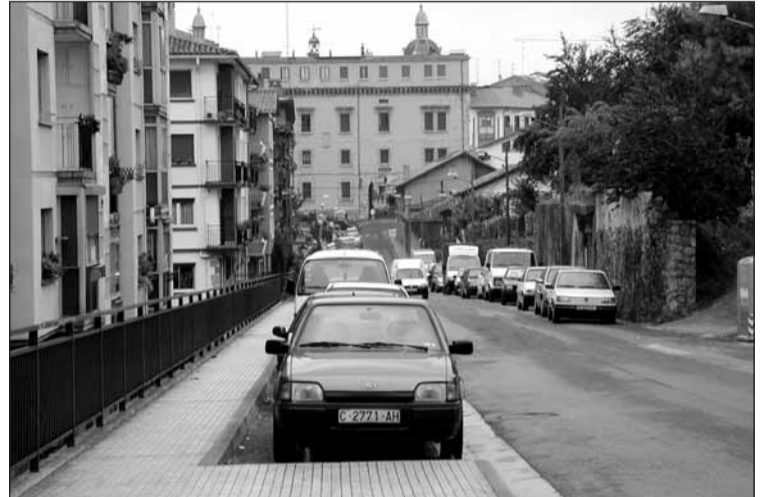
Lizeaga kalea goitik behera txukunduko dute.

Elkano, Portale Txoko, Lizeaga, Atzieta kaleetan eta Zikuñaga eta Sagastialde auzoetan ariko dira.