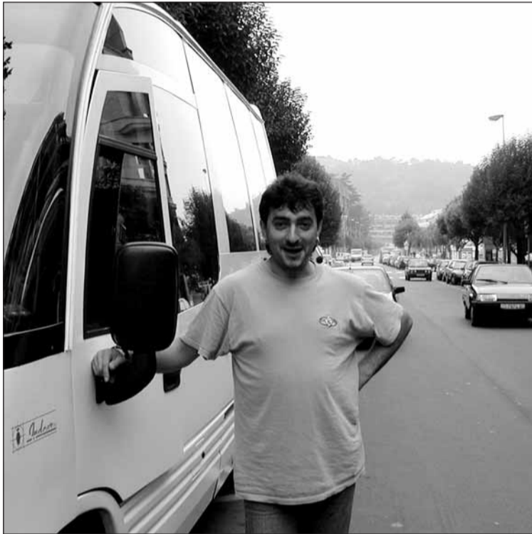
“Txope”: “Gipuzkoanok eskuinetik eta mantxoxio joan behar dute, karreteran erdixamarretik ibiltzen dira-ta.”

Gaur hasi eta hurrengo larunbatean bukatuko dira.