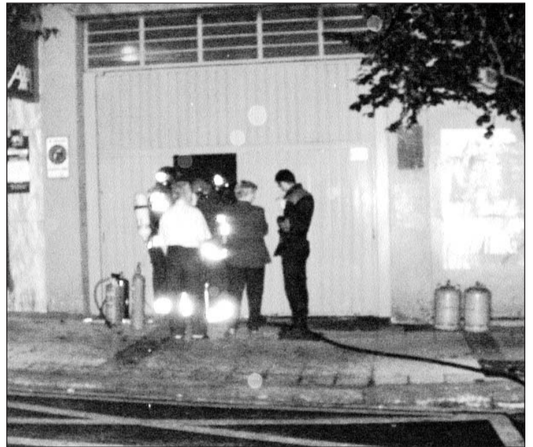
Sustu ederra hartu zuten bizilagunek, kortozirkuituak garajea sutu eta etxea argirik gabe utzi baizuen.

Goizaldeko 3etan kea sumatu orduko bizilagunek kalera irten behar izan zuten. Suhiltzaile, udaltzain eta ertzainek 4ak alderako baretu zuten egoera.