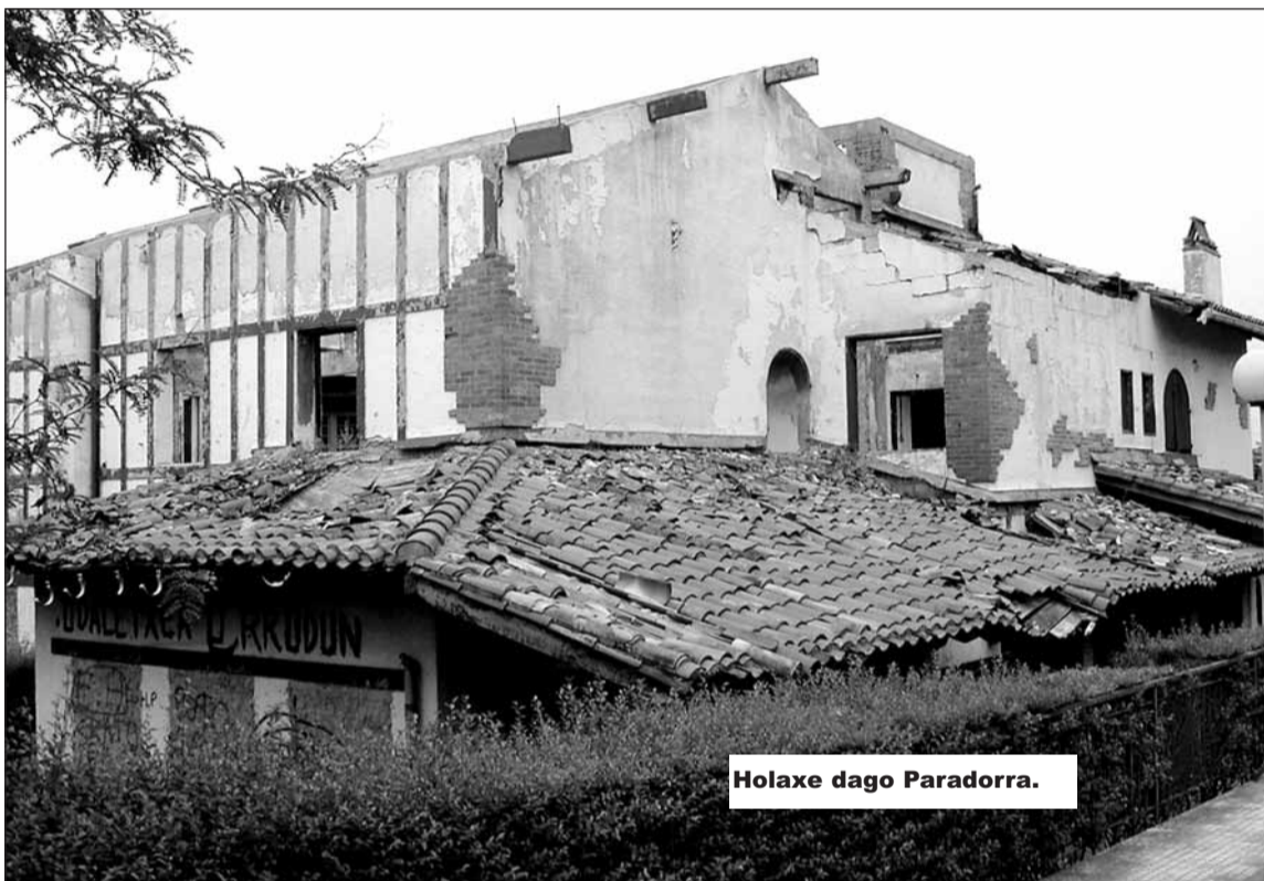
Holaxe dago Paradorra.

Tarteka umeak edo lotara datorrenik izaten da eta zerbait gertatuko ote den bel-durrez daude. Udalak proiektu baterako estudioa enkargatua du.