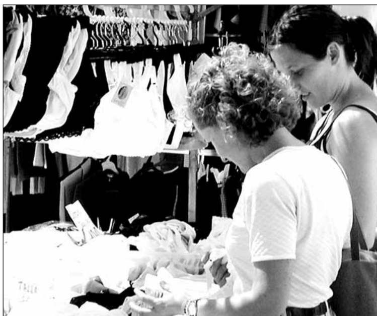
Merkea eta ona aurkitzeko asko bilatu behar!

Dendariak ezagutzen dute erosle jendeak ze erreakzio dituen merkealdietako kartel deigarrien aurrean: batzuk nahiago dute merke dauden 3 jertse eraman, gustatu zaien bakar bat baino. Beste batzuk ez dira merkealdietako apaletara hurbildu ere egiten, merkekeriak uxatuta. Halere, eta kuxkuxea-