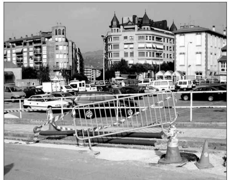
Gaur aparkatzerakoan gidari askok nahiago luke motoa balu.

Aparkalekua asfaltatzen hasi behar dute. Ezeren okerrik ez dela, egun bateko kontua izango da.