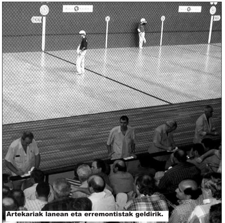
Artekariak lanean eta erremontistak geldirik.