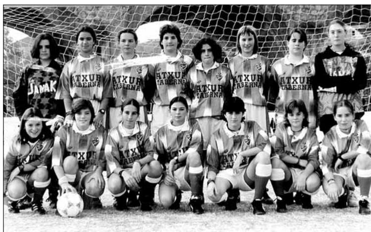
Hernaniko nesken taldean aritu izan zirenak.

EMAKUMEZKO futbol taldean sartu nahi duenak oraintxe du aukera: 14 urtetik gorako neskekin taldea osatzen hasiko baitira.