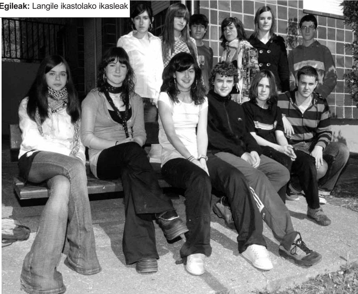
Egileak: Langile ikastolako ikasleak