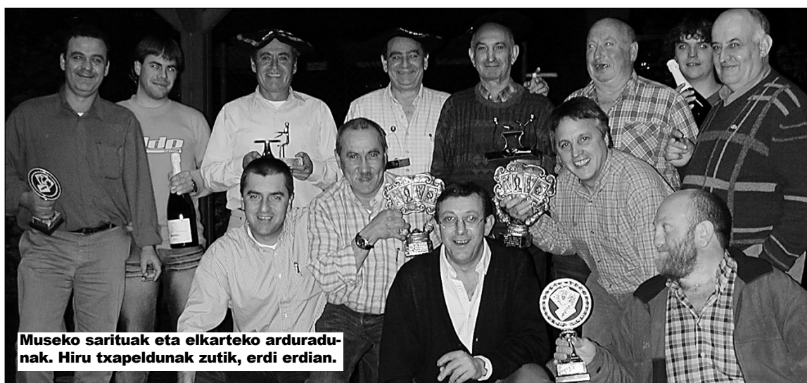
Museko sarituak eta elkarteko arduradunak. Hiru txapeladunak zutik, erdi erdian.

AEBak erori artean noski. Horri buruz ere hitz egin zuen eta kazetari itsasondoarraren ustez AEBak eroriko dira munduko nagusizatik. Bere ustez barrutik puskatuko dira gainera AEBak, bertako jendea iritsiko baita egiten ari diren sarraski guztiak ez irenstera. Gaur egun AEBri militarri beldur pixka bat sortu liezaioketen herrialdeei buruz ere aritu zen Aramendi, eta nola ez Txina aipatu zuen. Baina, kazetariaren ustez Amerikarrek Txina pakean utziko dute, bai baitakite hor zer galdu haundia daukatela. □