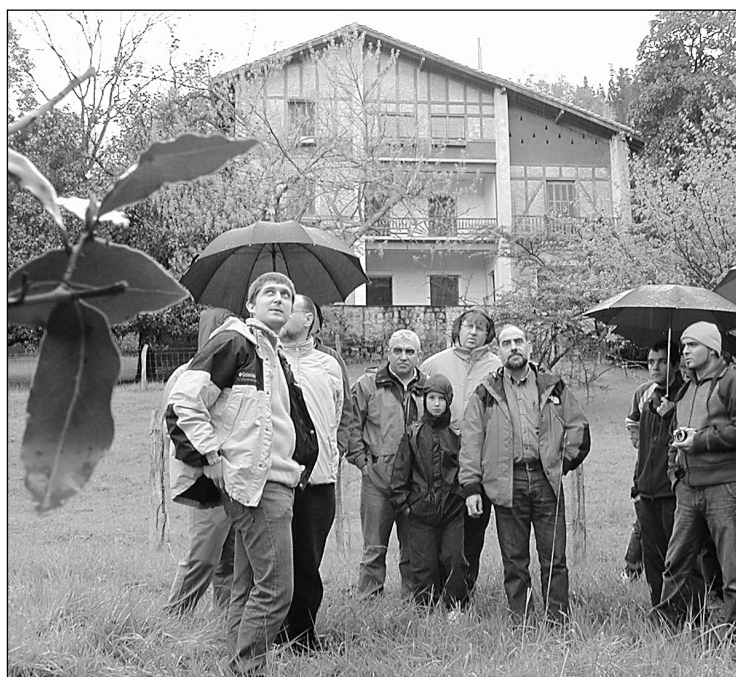
Goian Latsunbeko Ave Maria parkea eta behean Floridako Politena.

Etxebizitzak Bi parkeetan etxebizitzak dihoaz saihetsetan. Ave Marian Argarai aldera emango dute etxeek, Latsunbetik