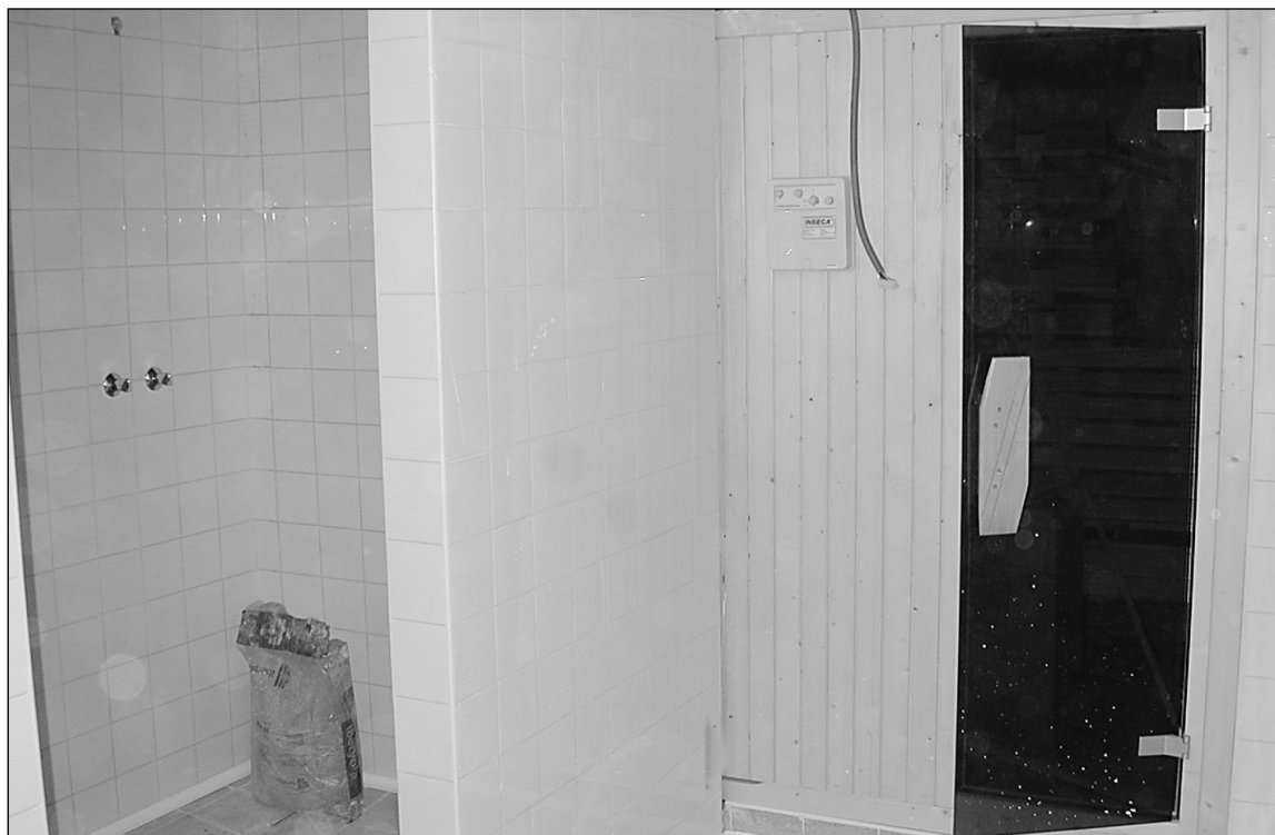
Sauna berrirako sarrera eskubian eta dutxa berriak ezkerrean.