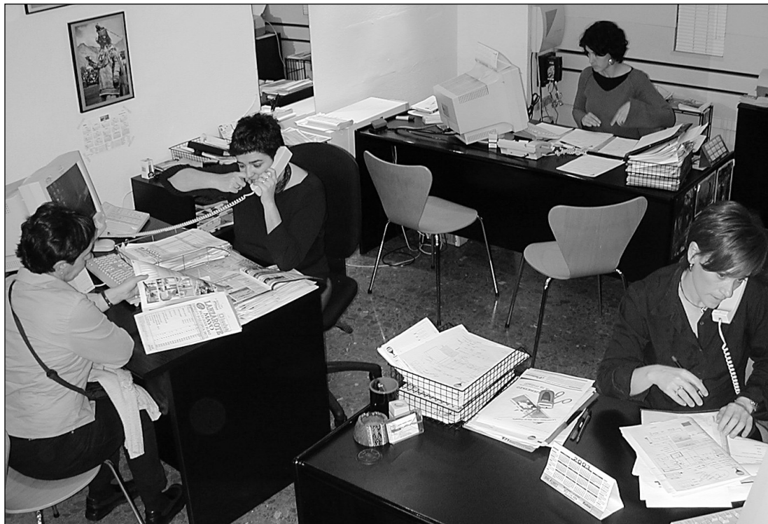
Herriko bidai agentziak lanez gainezka izaten dira Aste Santuan.

Aste Santuko oporrak Udako oporren sarrera izaten dira eta jendeak eguzki bila atera nahi izaten du gehien. Itsas ertzera eta hondartzara joan dira hernaniar gehienak, nahiz eta mendi aldera edo kultur bidaietara ere jendea animatu. Alojamentuari dagokionez hotelera nahi izaten du gehienak, dena egina izan dezala alegia, eta gazteagoak dira apartamentuetara-eta joaten direnak.