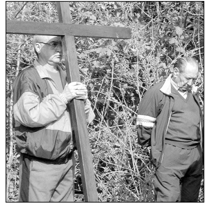
Kristau fededunak gurutze ondolan otoitzean, Santa Barbaran.

Aste Santua, abuztua eta sagardotegi bolada dira Hernaniko alojamentuetara kanpoko jende gehiena etortzen den garaiak. Bolada honetan aukera haundiagoa balego ere, bete egingo liriteke denak, baina, urte guztia ez omen da gero berdina izaten. □