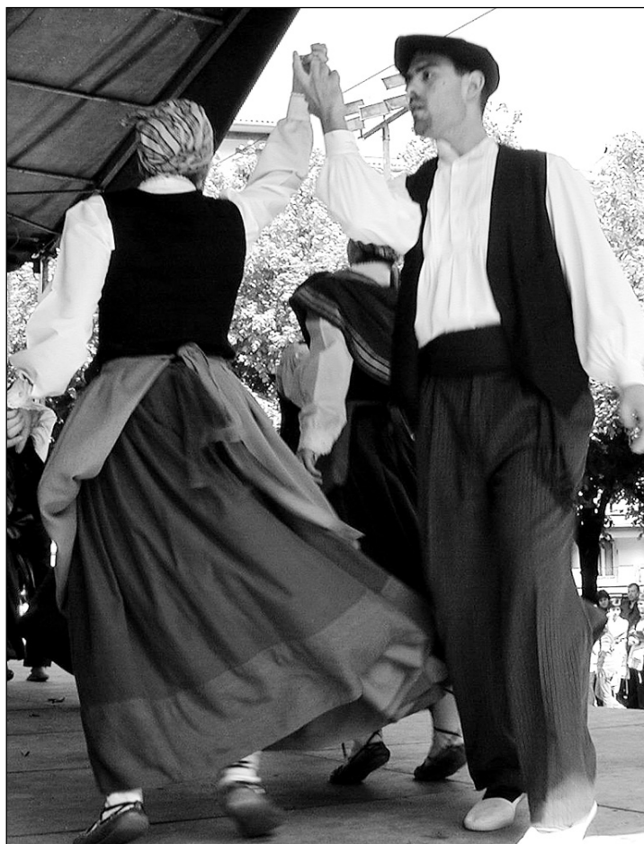
Dantzariak Tilosetan, iazko Dantzari Festan.

Kiroldegian ez dira saunakoak egiten ari diren obra bakarrak. Taberna ondoko bulegoetan obrak hastekoak dituzte eta bulego probisionalak jartzen ari dira ondoan. Orain, jendearentzako bulegoetara sarrera tabernaz beste aldetik dago, eta gerora igerilekuko kristaleraren paralelo jartzeko asmoa dute. □