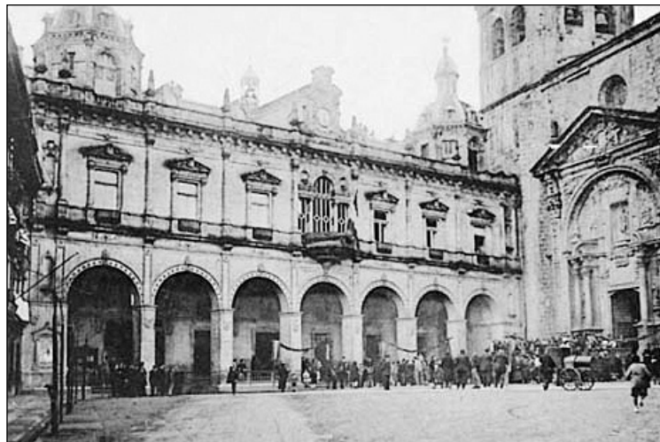
Hernaniko Udaletxea 1899an berritu zuten.

Lizeagako Paradorea. Argazki hau 1944an egindakoa da. Lehen etortzen zen jendeak lo egiteko erabiltzen zen, baita ere jatetxe bat zegoen, eta dirua zeukan jendea joaten zen, oso garestia baitzen. Paradore hau erre egin zen eta horren ondorioz ez zen berriro erabili paradore bezala eta urte askotan erabili gabe egon da. Gaur egun oraindik Udalak ez du erabaki zertarako erabiliko duen edo zer egingo duen leku horretan. □