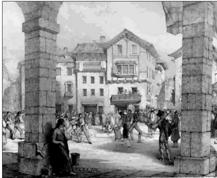
1836an itxura hau zuen gaurko Gudarien plazak.