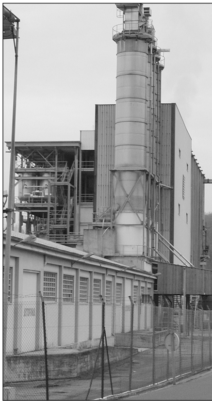
Arrisku handiko 3 enpresa dauzkagu.

Aurreko guztiaren ondorioz esan daiteke hernaniarrok arriskuan gaudela. Zenbaterainokoa da arriskua? Bermatzen al da segurtasuna? "Segurtasun-plana" eraginkorra al da? Iristen zaigun informazioa fidagarria al da? □