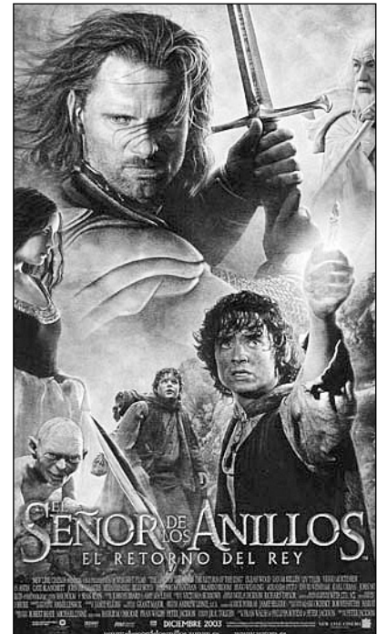
"Eraztunaren jabea, erregearen itzulera" filmeko kartela.