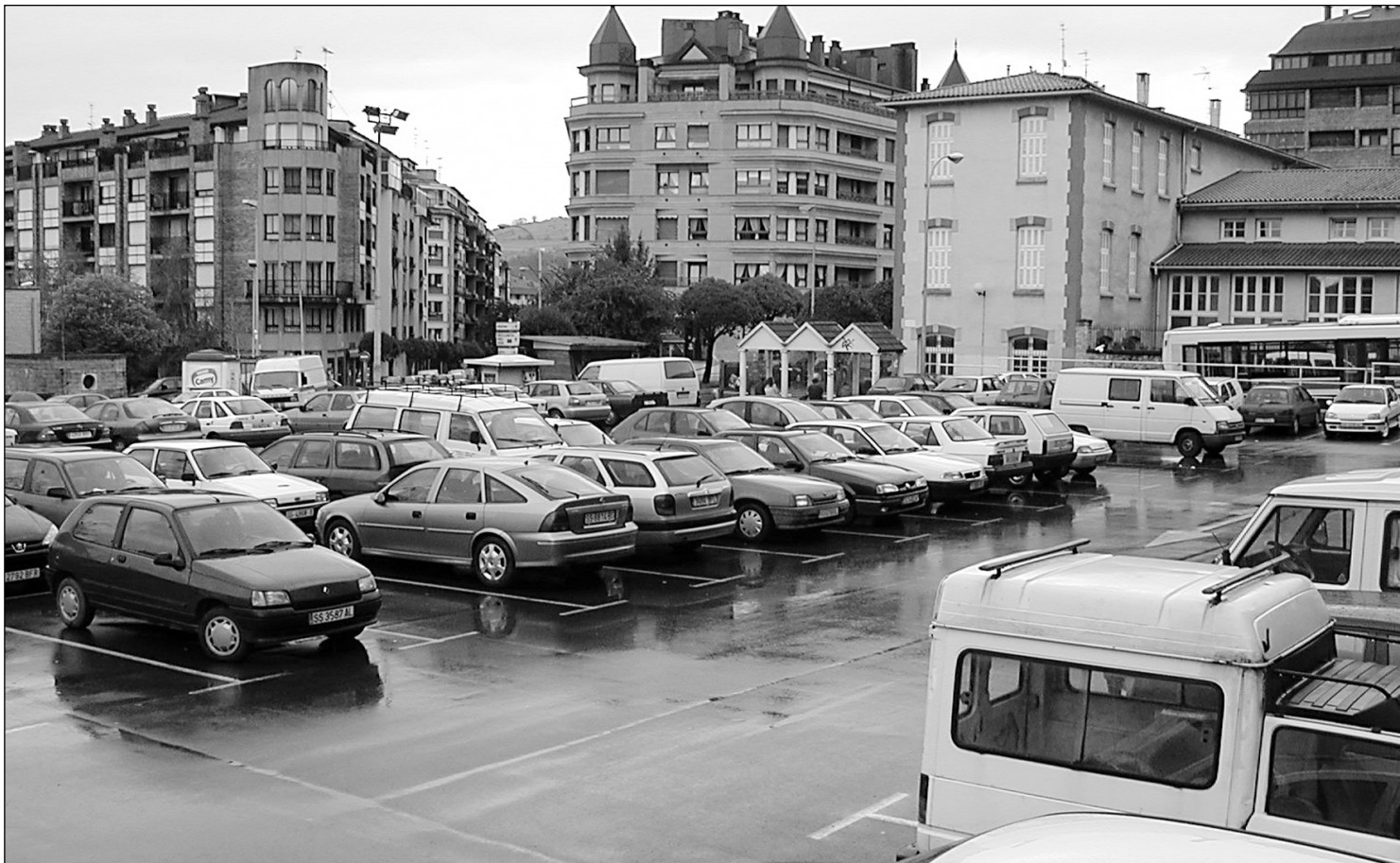
Atsegindegin lur azpira hiru pisu lituzkeen aparkalekua joango litzateke eta gaikaldean toki estali bat egin nahi da.