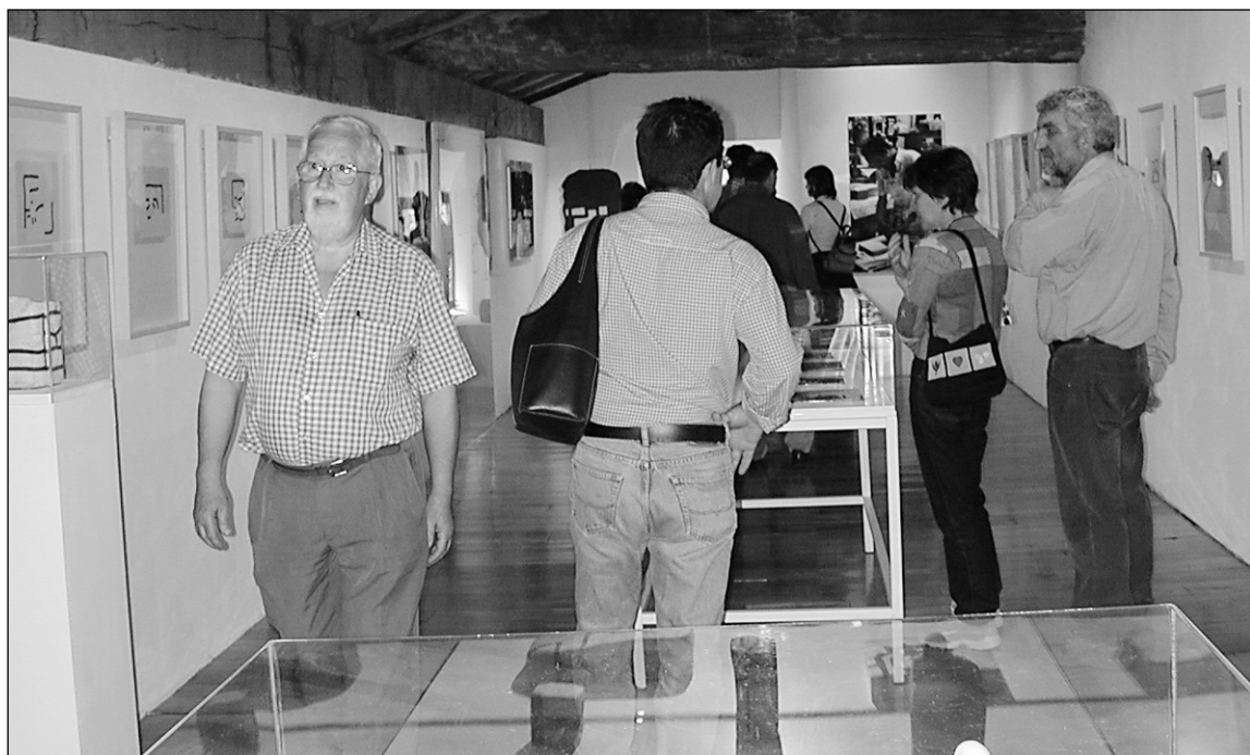
Eduardo Chillidare 'Uneak' erakusketak ere bisitari asko izan zuen Zabalaga baserrian.