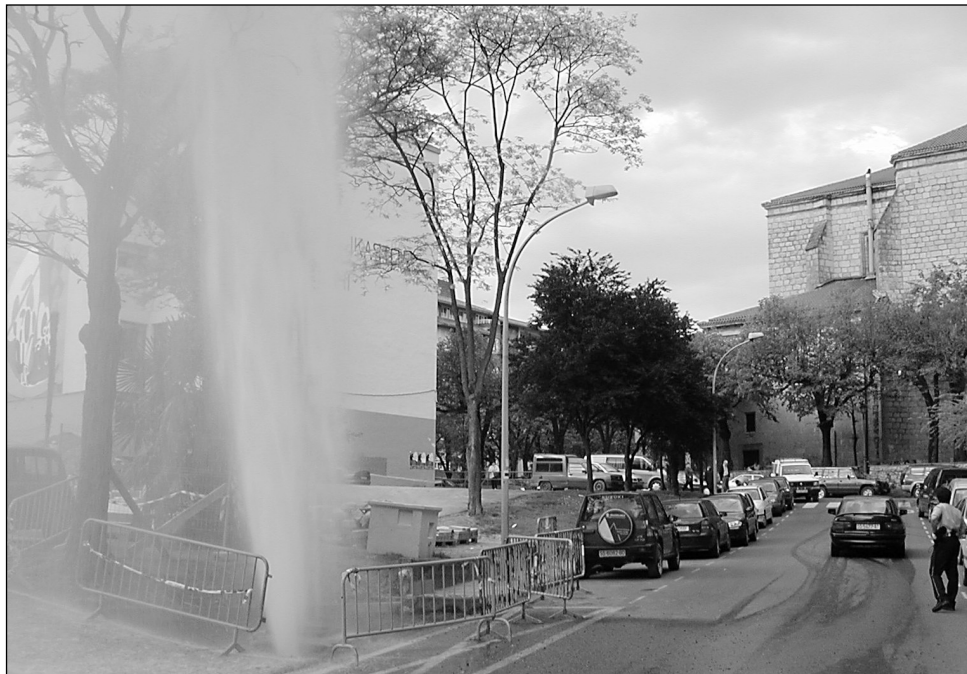
Ur txorota presio handiarekin ateratzen zen atzo.

ATZO arratsaldeko seiak inguruan uraren tuberia puskatu eta festa polita jarri zen Larramendi kalean. Arketa berria jartzen ari dira aparkalekurako sarrera horretan eta uraren pasoa ixten duen giltza ere berrietzekoa dute. Dirudenez, ume koskorren batek baila pasa eta ostikoka puskatu zuen giltza eta 5 zentimetro inguruko zuloa egin zion tuberiari. Ur txorota 19:00ak inguruan itxi zuten Udaltzainek. Arketa berria jartzeko gaur goizean ura kentzekoa zuten Larramendi kaleko zenbait portaletan, baina, ezbeharrak medio atzo arratsaldetik gaur 12:00ak arte egongo da itxita. □