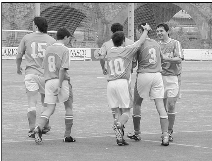
Hernaniko mutilak zortzigarren gola sartuta.

GORENGO taldeak hiru puntu garrantzitsu lortu zituen atzo, Berako Gure Txokoa taldeari 9-1 irabazita. Hernaniarrek ez zuten kontrariorik aurkitu aurrean, eta aukera aprobetxatuta, 9 gol egin zizkien beratarrei. Orain Hernani hobeto dago sailkapenean, ia maila galtzeko arriskurik gabe, eta denboraldia bukatzeko 5 partidurik besterik gelditzen ez direla. □