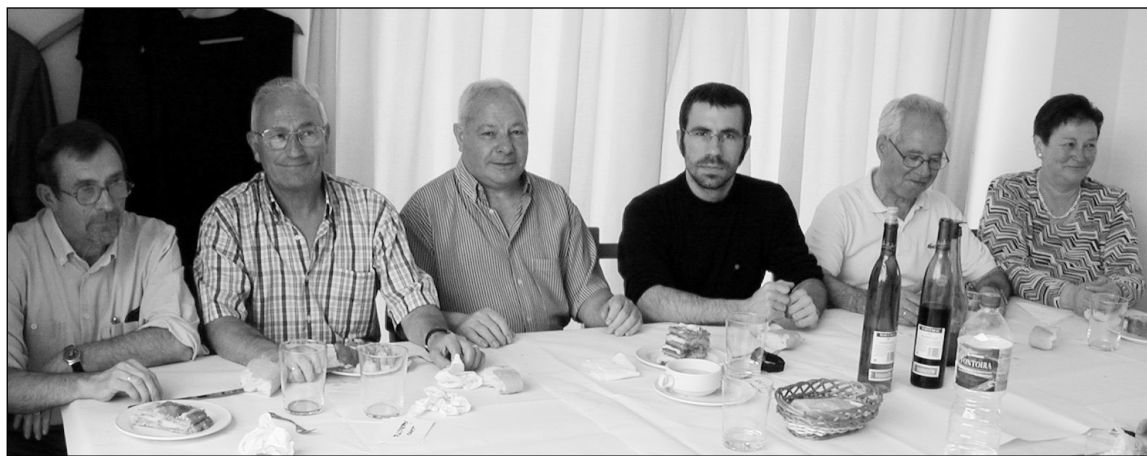
Junta zaharreko eta berriko kideak, tartean Ongintza patronatuko burua dutela.