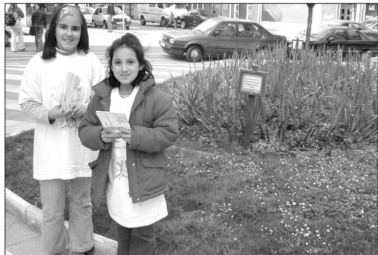
Bi ikasle parkeak zaintzeko dioten paperak banatzen.