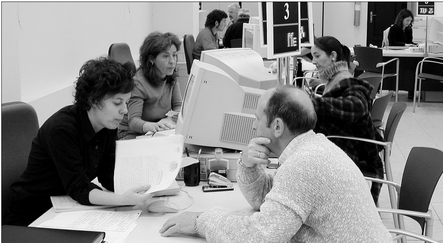
Hernaniko bulegoan jendea ari da Errenta Deklarazioa egiten. Atzorako 180 lagunek txanda hartuta zuten.