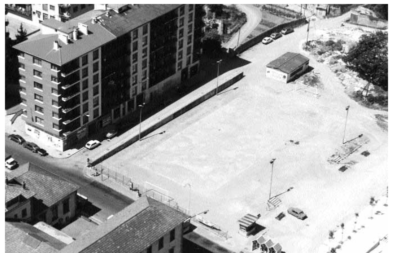
1986. urtean, Atsegindegi futbol zelaia zen. Futbol partidak jokatzen ziren eta jende asko inguruetako herrietatik etortzen zen partidak jokatu eta ikustera.