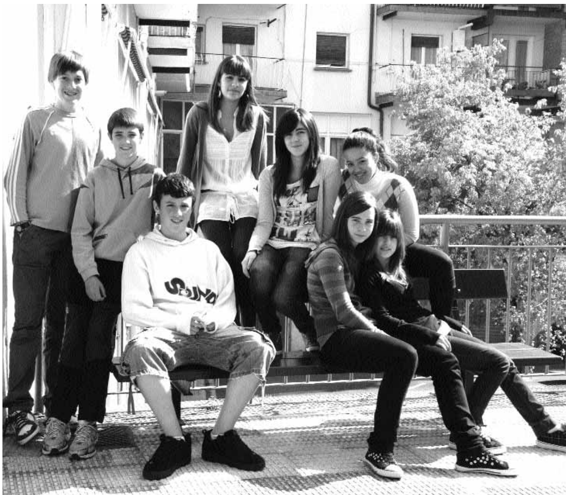
Gaurko Ikasleen Txokoa egin duten Urumea Ikastolako ikasleak.