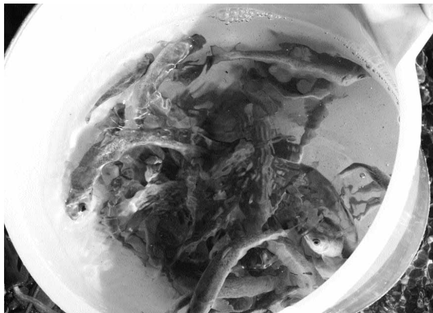
Izokin kumeak Urumean bota aurretik.

Karabelen izokin kumeak askatzen dituzte baina gutxi batzuk bizirik irauten dute epe luzean. Izokin kume horiek "txip" batekin askatzen dituzte. Duela hilabete bat gutxi gorabehera, askatutako izokin bat Billabonan, Oria ibaian zebilela ohartu ziren. Handik egun gutxi batzuetara, izokina Elorrabiko presan dagoen konpuertan sartu zen. Oso handia zen. ||