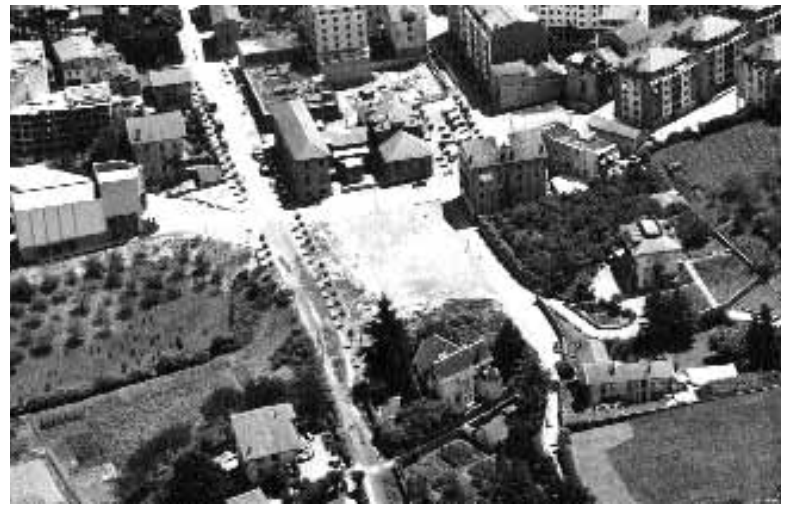
1961. urtean dagoeneko futbol zelaia zen Atsegindegi. Hori ez da ordea, ordutik hona aldatu den gauza bakarra.