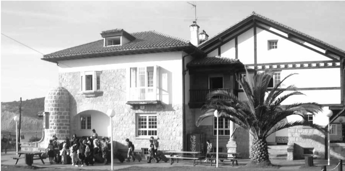
Aterpetxeak berak oroitzapen onak ekartzen dizkie ikasleei.

Urrian Bizkaian barrena ikasleek egindako txangoa.