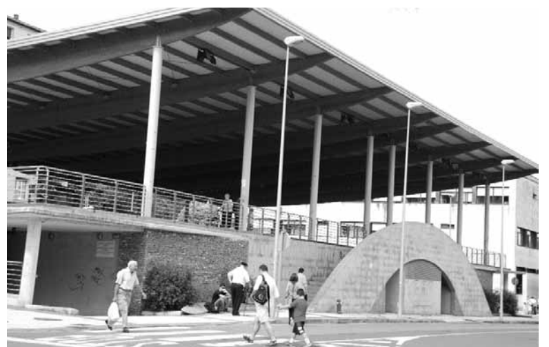
Orain plaza estalia da eta azpian aparkalekua du.