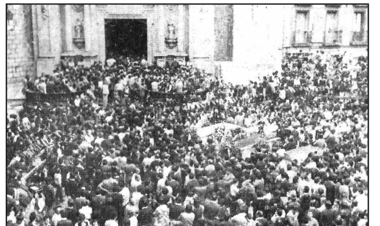
Orduko egunkariak diotenez, 7.000 lagun inguru bildu ziren Juan Bataiatzailea parrokiaren elizkizunetan.