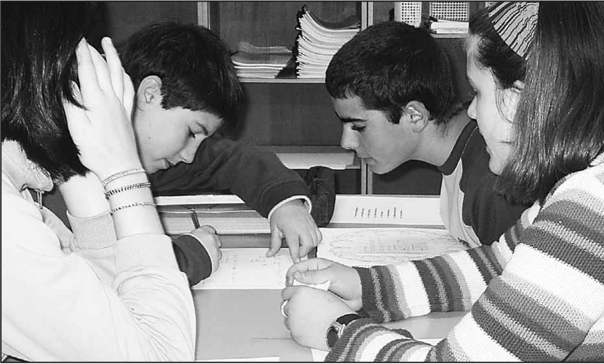
Langile ikastolako Santa Barbarako zentroan, ikasleak talde lanean.