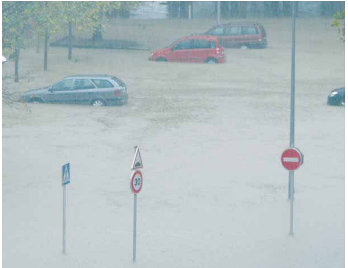
Uholdeen kontrako neurriak lehenbailehen hartzeko eskatu du Eusko Legebiltzarrak.

Eusko Legiltzarrak eskatu du, uholdeen kontrako obrak lehenbailehen hasteko Uholdeei buruz hitz egin du Eusko Legebiltzarrak ere, eta hainbat eskaera egin ditu. Batek, administrazio guztiei eskatu die, lehenbailehen hartzeko neurriak uholdeen