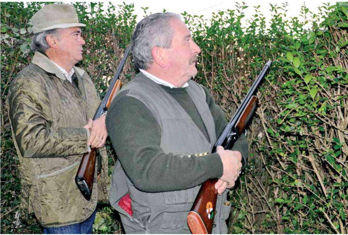
Aurten ere usoa urrutitik pasatzen ikusi dute.

EHIZA - BEDA OSOA ZABALIK URRIAREN 12TIK URTARRILAREN 31RA