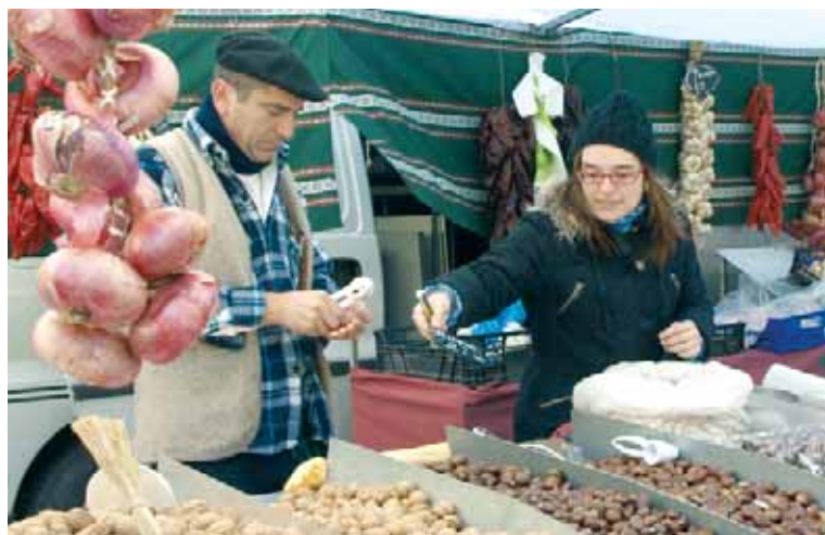
Denetarikako postuak jarriko dituzte gaur, 60tik gora.

Ale gorria bilatu, eta muxu Azoka orduan ikuskizuna ezin falta, eta hainbat artisauek bertan ariko dira harria tailatzen, harizko galtzerdiak egiten... baina