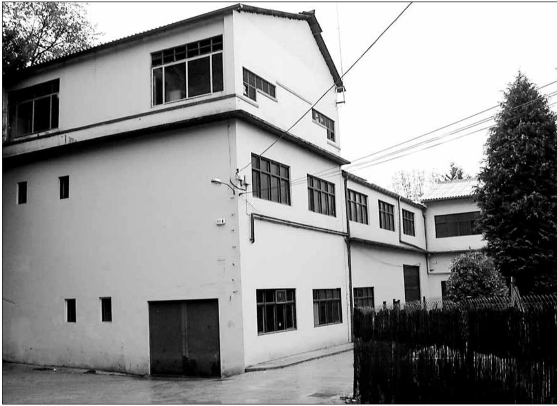
Ongintzak Traspakarreko etxe honetan ematen ditu Langairako formazio ikastaroak.

■ Zerbitzuak bi urte daramazki eta 71 pertsoneri bilatu die lana ■ Orain, unibertsi-tatean ikasiak ez beste denek jo lezakete 'Langai'ra.