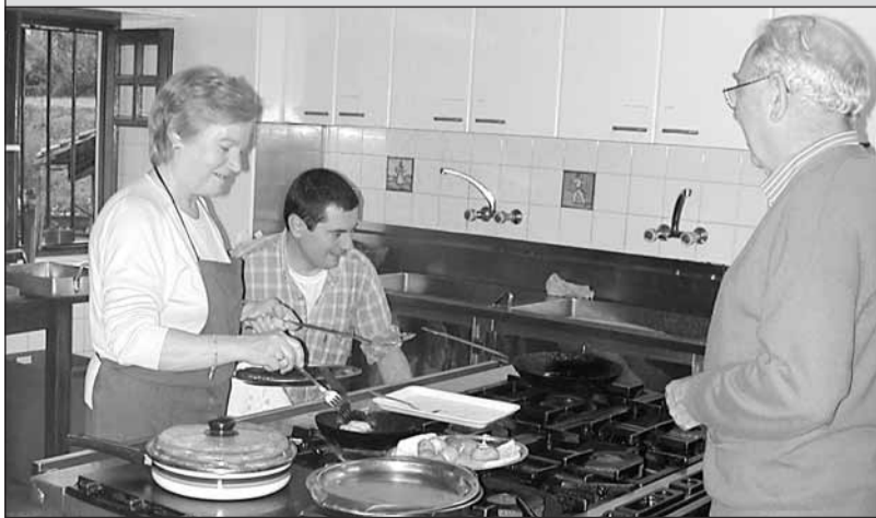
Xalaparta elkartean bazkaria jartzen atzo eguerdian.

■ Atzo itxi zen izen emateko epea ■ Datorren larunbatean Hernani, Astigarraga eta Urnietako 10 sagardogile izango dira.