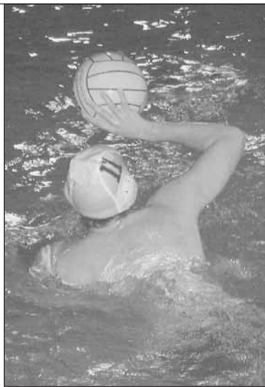
Hernaniko Waterpoloko jokalaria bat erasoan.