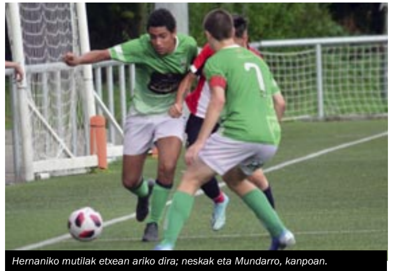
Hernaniko mutilak etxean ariko dira; neskek eta Mundarro, kanpoan.