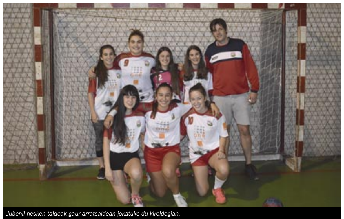
Jubenil nesken taldeak gaur arratsaldean jokatu du kiroldegian.

Gabonetako zozketa egingo du, aurten ere, Hernaniko Eskubaloi Taldeak, eta dagoeneko salgai dituzte errifak 2,5 euroan. Zozketatuko duten otarra Anexo Elektrotresnaken jarriko dute, laster. ||