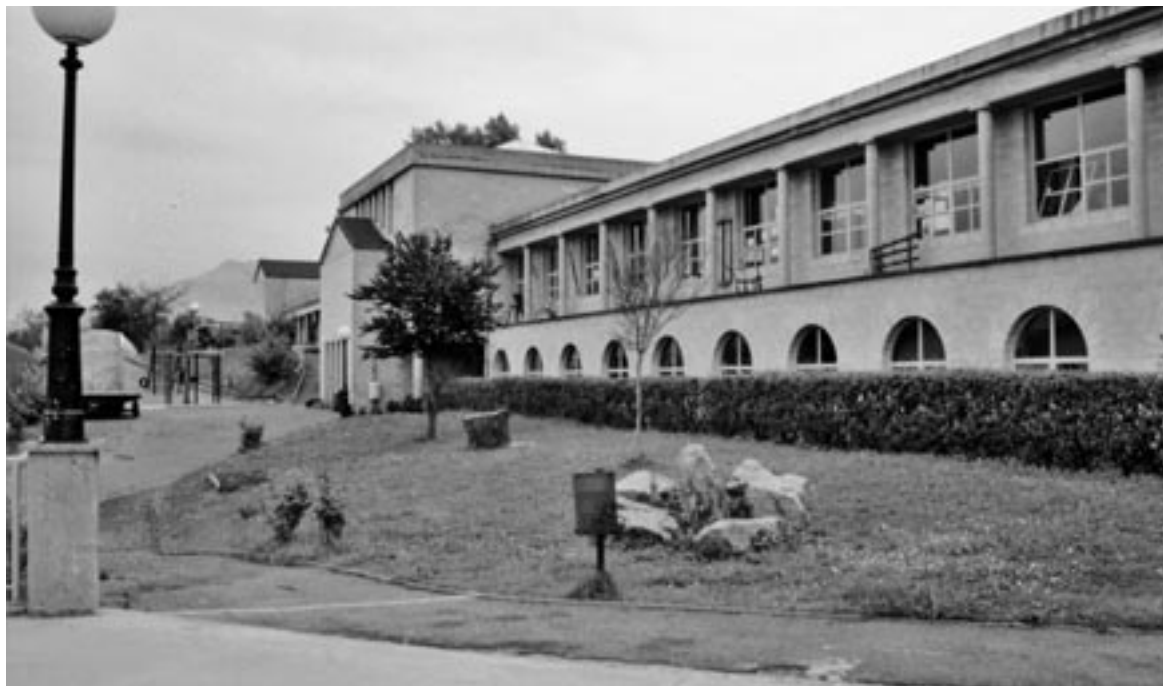
Laubidietakoa izan zen aurreneko eraikina; 1982ko Kilometroetako diruarekin erosi zuen Udalak lurzorua.

50 urte hauek pasa arren, irakasleek uste dute sorrerako oinarriak mantentzen dituela, eta «ez duela iparra galdu». Dena den, haien ustez, egokitzen jakin du; izan ere, «historian ez da ezer geldirik egoten, eta eskolak ere ezin du egon, garai berrietara egokitu behar da». Eta hor egongo da gakoa: «momentu batean hau amets bat izan zen, eta amestu genuenok egin dugu bidearen zati bat, eta gelditzen direnek edo datozenek jarraitu beharko dute bide hori egiten edo amesten». Agian, beste 50 urtez. ||