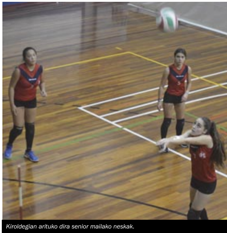
Kiroldegian arituko dira senior mailako neskek.

taldearen kontra jokatu dute kadete mailako neskek.