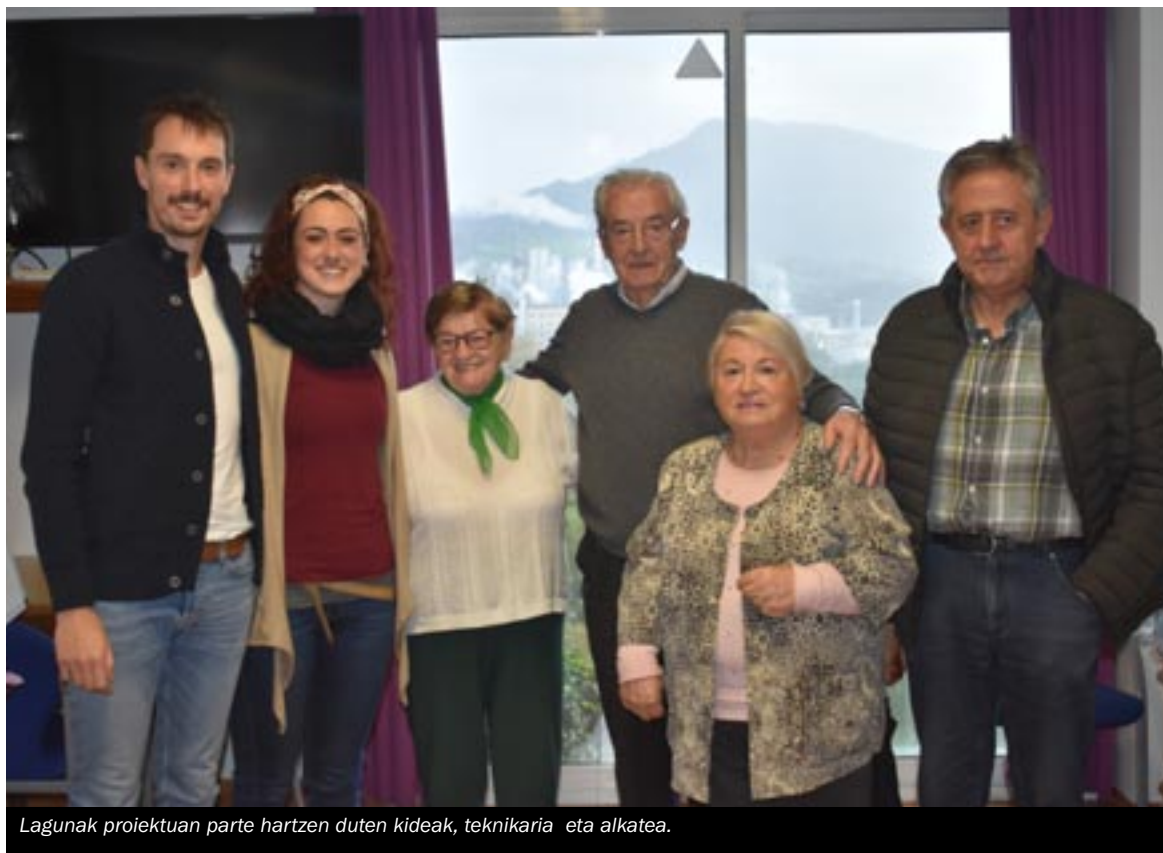
Lagunak proiektuan parte hartzen duten kideak, teknikaria eta alkatea.

Helduei gonbitea luzatu nahi izan diete Lagunekin proiektukoek, denon artean helduen egunerokotasuna au-