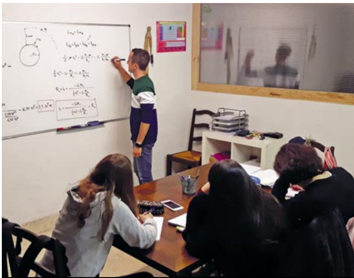
Talde txikietan lan egiteko aukera ematen dute akademiek, gertuko tratua emateko.

Dena ez dago ikasleen esku, ordea. Horregatik, ezinbestekoa den beste elementu bat ere eskaintzen zaie akademian izena ematen dutenei: gertuko tratua eta erosotasuna. «Eskolako girotik pixka bat urrunduanahian, gure helburua da ikaslea akademiara gustora etortzea, horrek asko laguntzen baitie ikasteko garaian». Horregatik, talde txikietan ematen dira klaseak, normalean, eta maila bereko ikasleak bilduta, «denbora ahalik eta ondoen aprobetxatzeko».