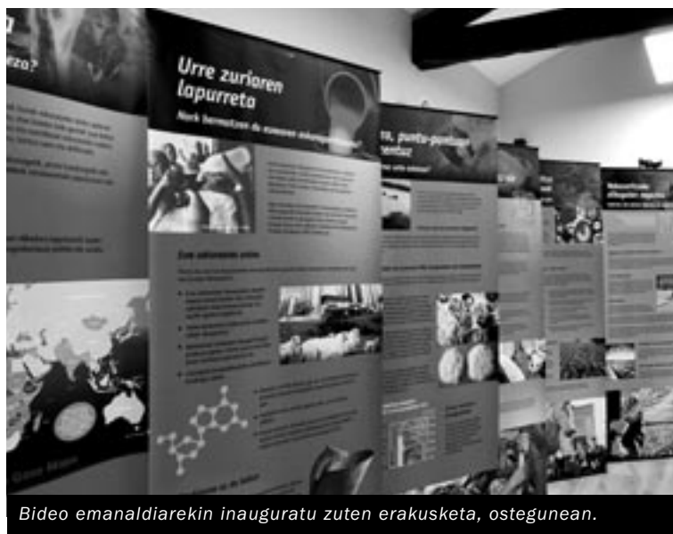
Bideo emanaldiarekin inauguratu zuten erakusketa, ostegunean.