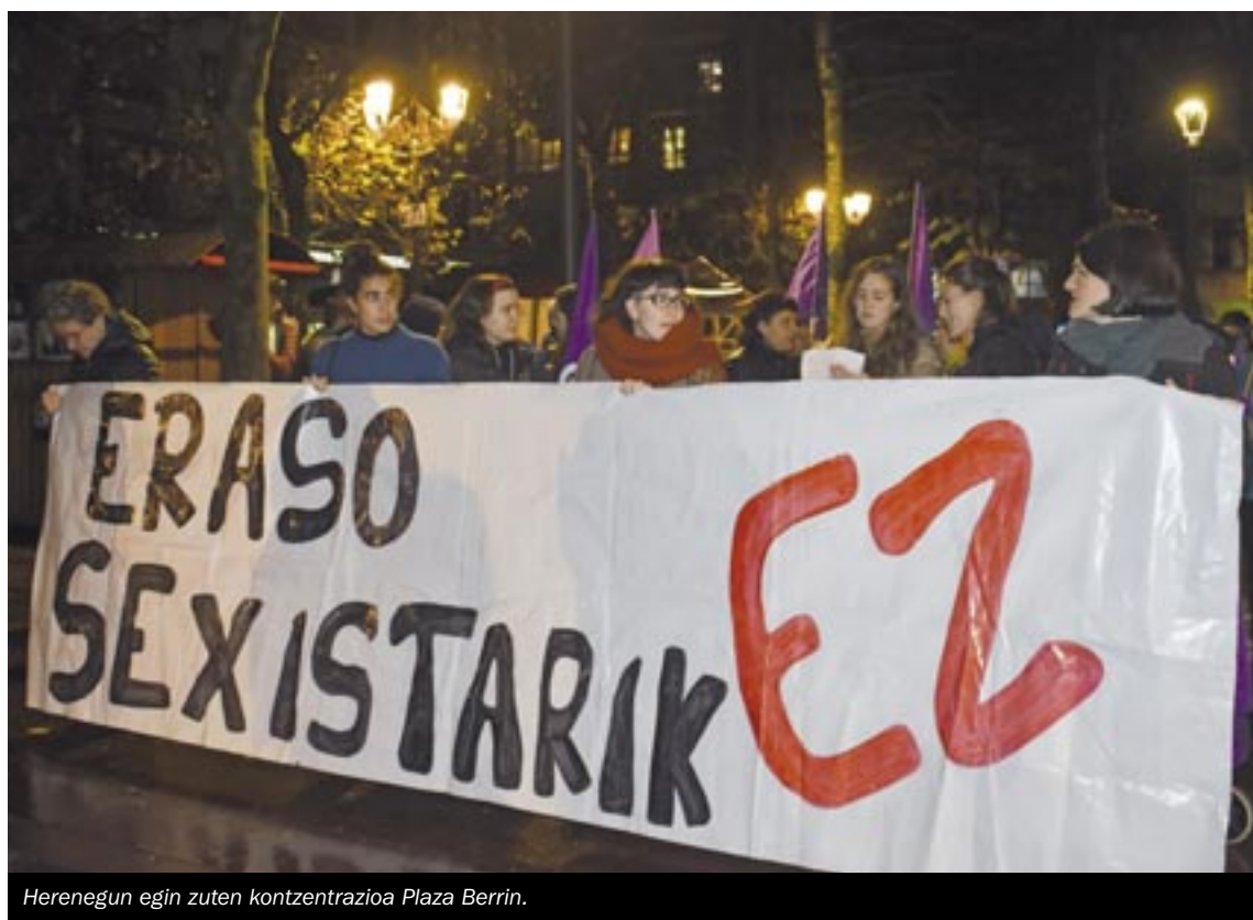
Herenegun egin zuten kontzentrazioa Plaza Berrin.