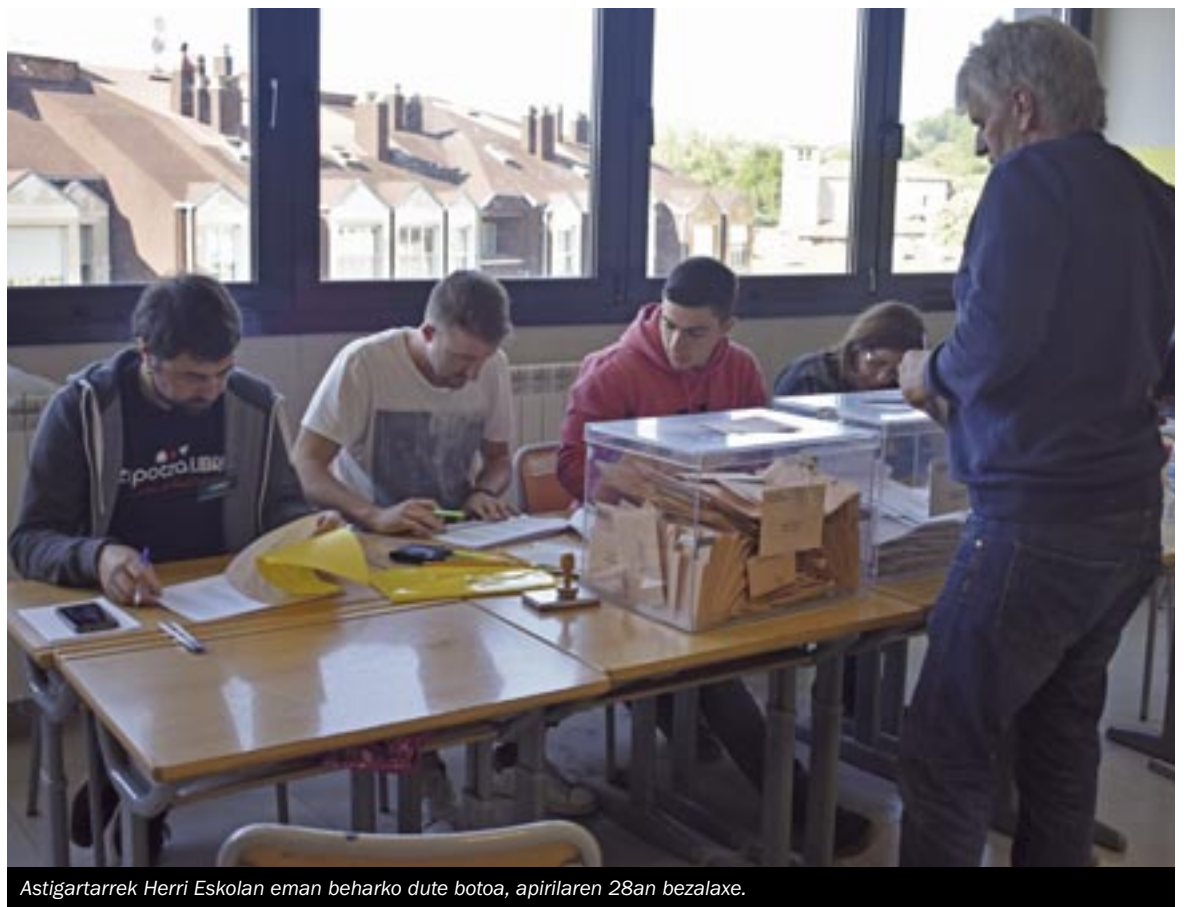
Astigartarrek Herri Eskolan eman beharko dute botoa, apirilaren 28an bezalaxe.

Eta Nafarroan, aldiz, hamarna: EH Bildu, NA+, PSOE, PACMA, Geroa Bai, PUM+J, PCTE, Podemos-IU, Recortes Cero-GV eta Vox. Aurreko hauteskunde orokorrekin alderatuta, hiru hautagaitza gehiago aurkeztu dira Nafarroan Senaturako. ||