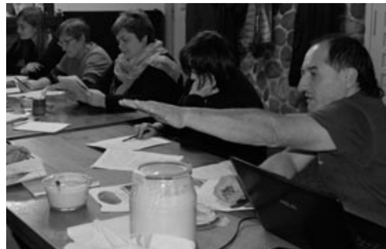
Atzo hasitako ogi tailerra gaur borobilduko dute, dastaketarekin.