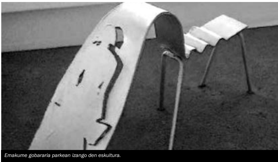
Emakume gobararia parkean izango den eskultura.

Node taldeak dantza garaikidea eskainiko du, beraz egun paregabea izango da. Hala ere, euria eginez gero, beste egun batera pasako da inaugurazioa. ■