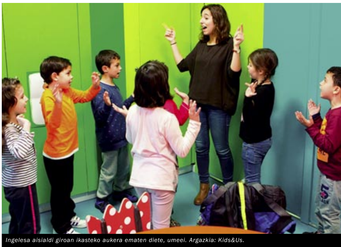
Ingelesa aisialdi giroan ikasteko aukera ematen diete, umei.

Dena den, sekula ez da berandu hizkuntza berriak ikasteko ere. Horregatik, London School akademian maila desberdinetara egokitutako klaseak ematen dituzte, haur, gazte zein helduentzako: ingeles orokorrekoak, azterketa jakinak prestatzeko klaseak edota klase partikularrak. Horrez gain, udaran ikastaro trinkoak ere izaten dira aukeran, eta atzerrira ikastera joateko aukera ere ematen dute. Era berean, enpresa eta eskoletara egokitutako klaseak ere ematen dituzte, eta baita hizkuntzak irakatsiko dituzten irakasleak formatzeko saioak.