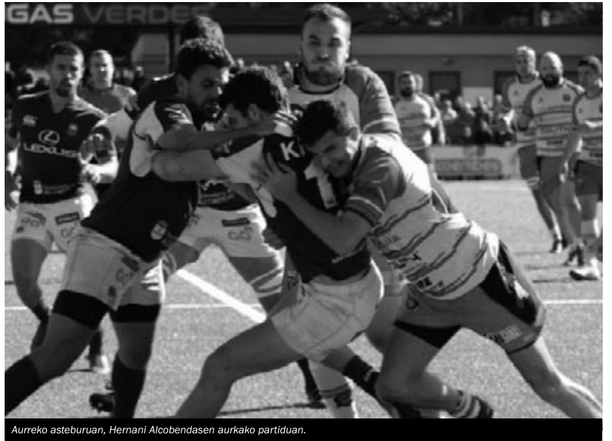
Aurreko asteburuan, Hernani Alcobendasen aurkako partiduan.

Euskal Ligan, bestalde, emakumezkoen Landarbaso taldeak etxetik kanpo jokatu du asteburuko jardunaldia. Bihar