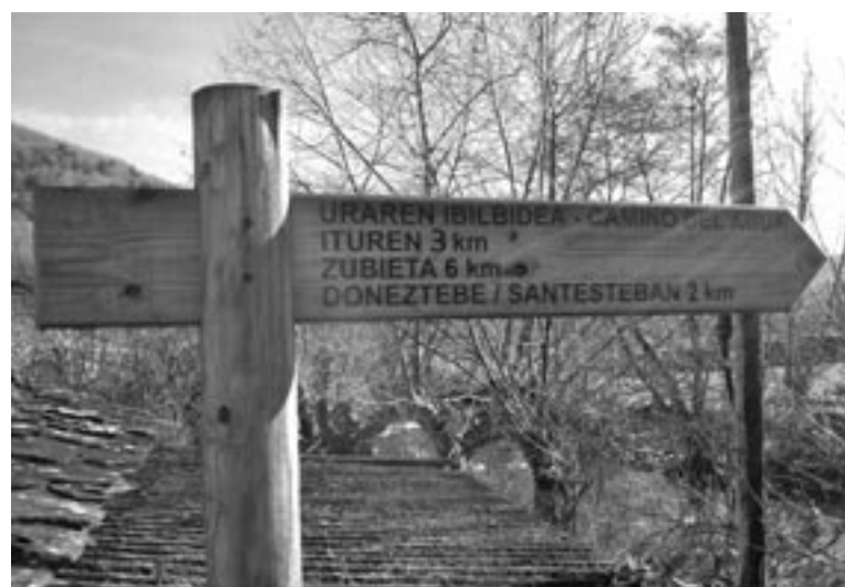
Landa garapenerako proiektuen artean lagundutakoa da Uraren Ibilbidea.

Laguntza eskatzeko bete behar diren baldintzen berri, eta bete beharreko eskaera orriak Cedernaren webgunean lortu daitezke: www.cederna.eu . Teknikari arduradunarekin harremanetan jartzeko modua ere bertan topatu daiteke. ||