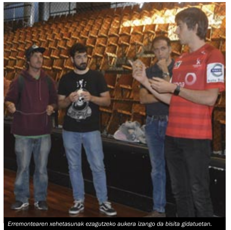
Erremontearen xehetasunak ezagutzeko aukera izango da bisita gidatuetan.

Izen ematea, Kronikan Bakarka, binaka edo taldean eman daiteke izena, eta 25 lagun biltzean taldea itxiko da. Horretarako, interesa duenak Kronikara gerturatuta eman dezake izena, kronika@kronika.eus helbidera mezu bat bidaliz, 943 33 08 99 telefono zenbakira deituz edo 688 660 714 mugikorrera WhatsApp mezu bat bidaliz, bisitaren eguna zehaztuz. ||