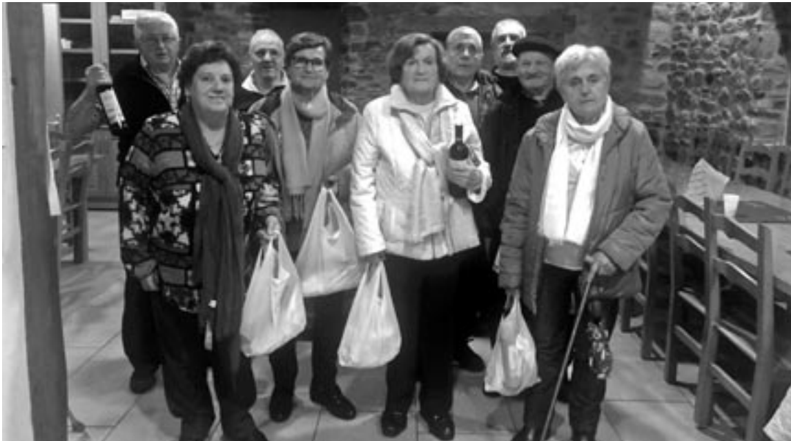
Mus eta Truk txapelketetako irabazleek sari ederrak eskuratu zituzten, larunbatean.