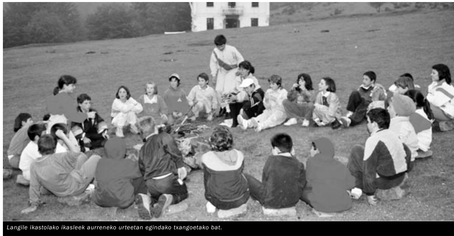
Langile ikastolako ikasleek aurreneko urteetan egindako txangoetako bat.

Momentu hartan gertatzen ari zenak ere asko lagundu