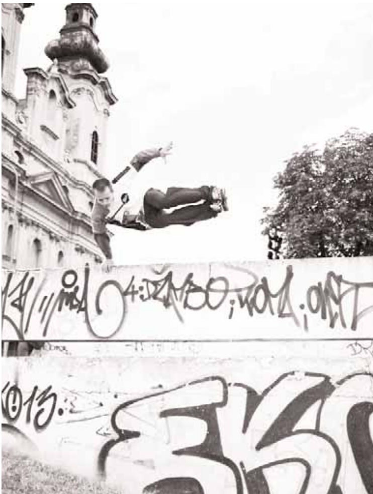
Noizko ikusiko ditugu horrelako irudiak Hernanin?