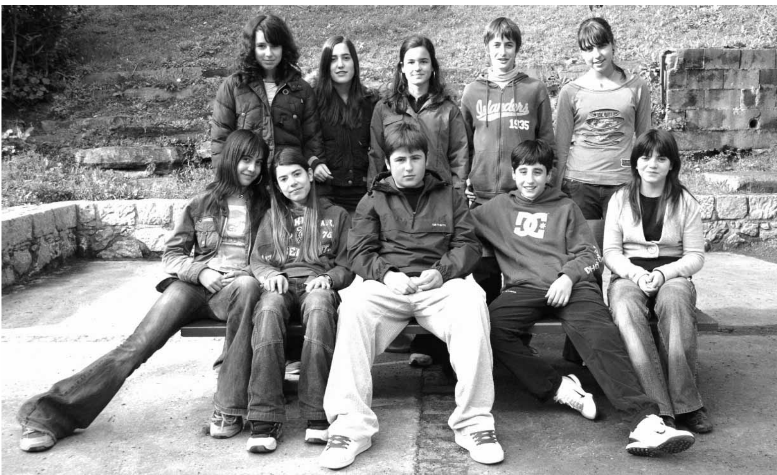
Urumea ikastolako ikasleak, gaurko Ikasleen Txokoaren egileak.