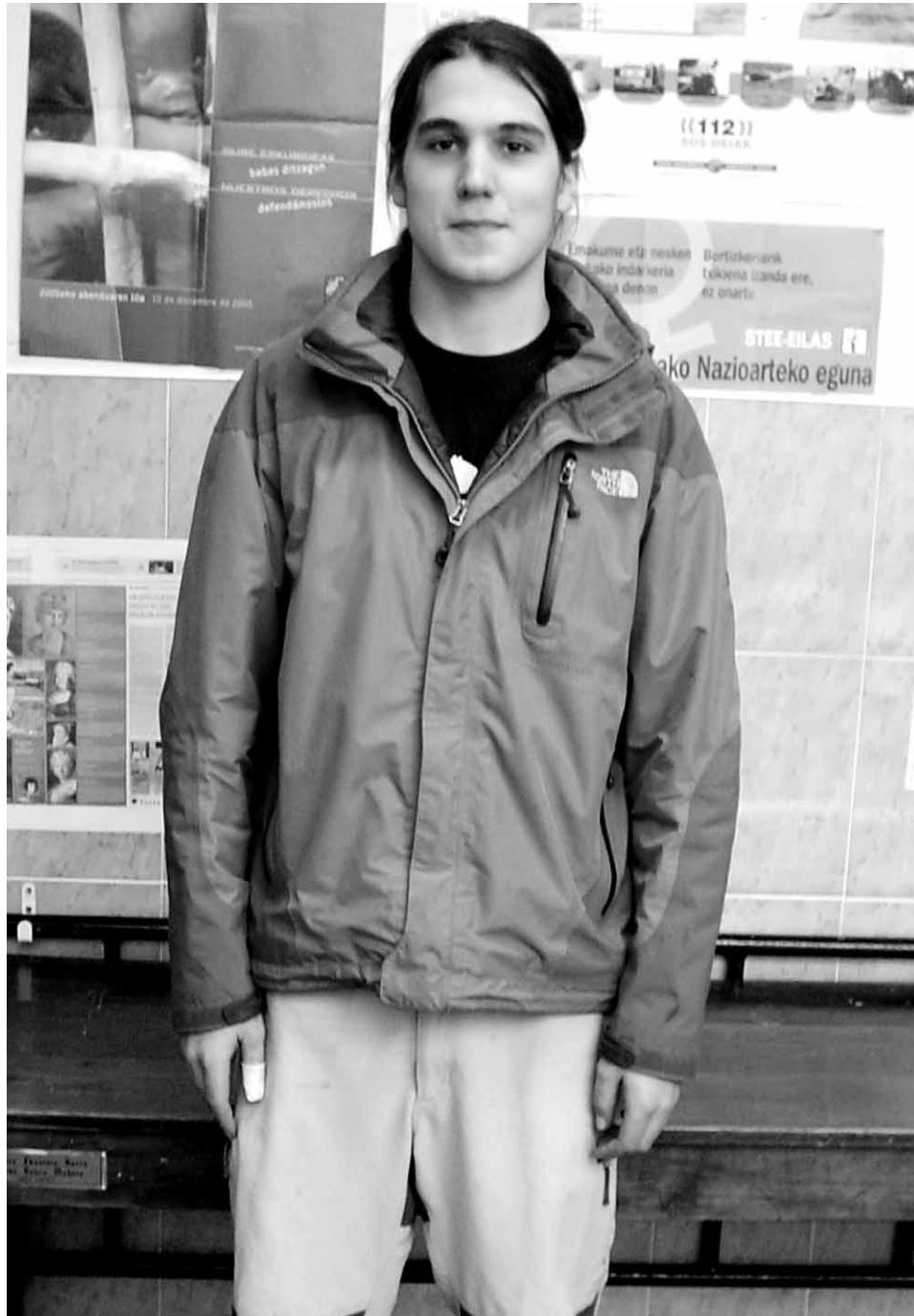
Iñigo Gorrotxategi Ikastolara egindako bisitan.

Gustatuko litzaidake Senior mailako jokalariekin jokatzea, beno, orain batzuetan jokatzeko dut beraiekin, baina nahiko nuke beren taldean sartzea asteburuero jokatu ahal izateko.