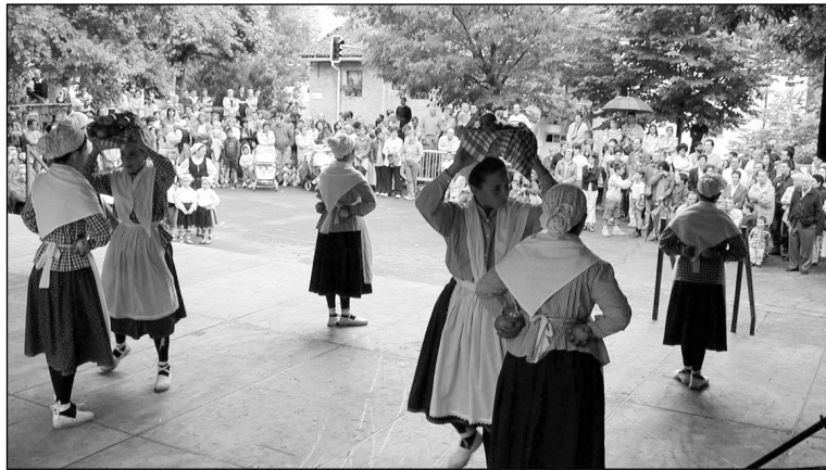
Dantzariak tabladuan iazko San Antoniotan.

10:00etan , kalejira izango da. 10:30ean , Meza Nagusia San