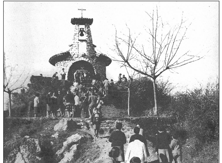
Santa Barbarako ermitan mezetara jendea.

Aurtengo jaietan ekintzarik deigarrienak, bertsopaper emanaldia, arraun desafioa eta igandeko bertso jaialdia dira, beraz, badakizue, anima zaitzete eta etorri Ereñozura. □