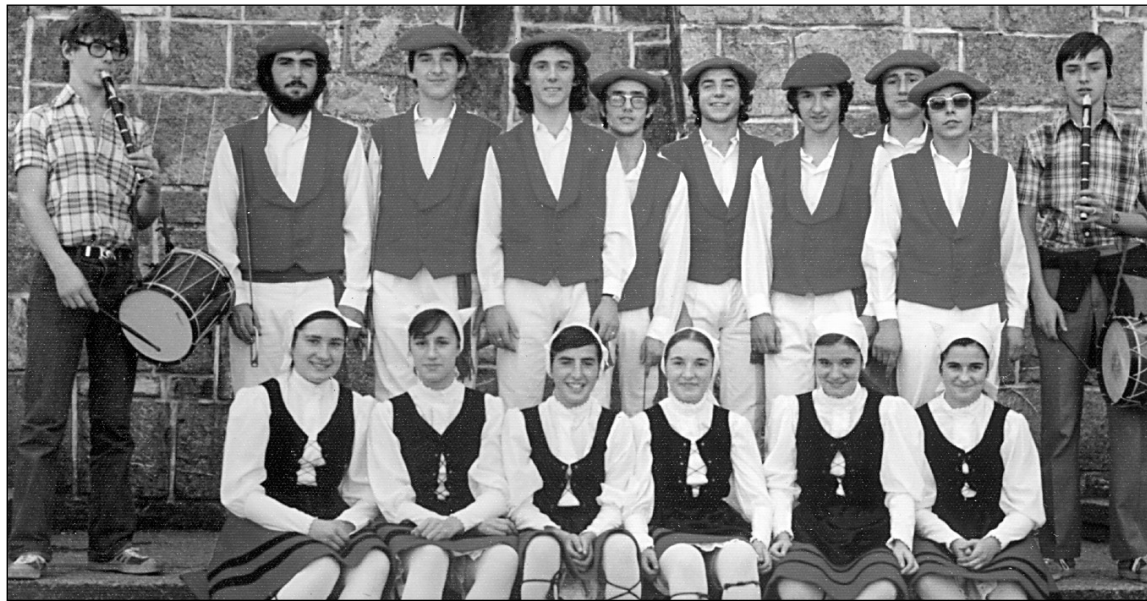
Ekintza dantza taldeko lehenengotako partaideak.