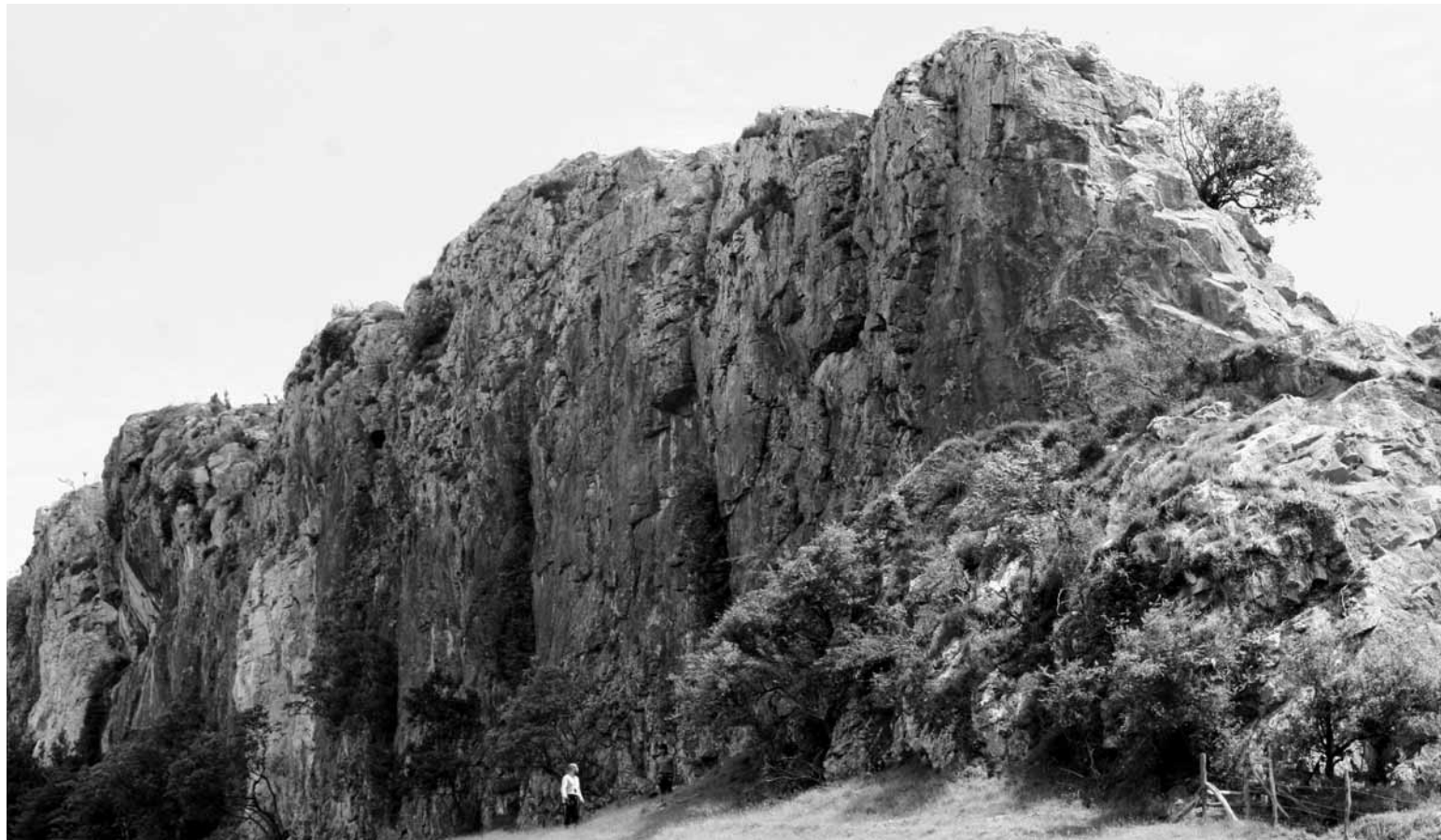
Santa Barbara da lekurik aproposena aire librean eskalada egiteko.

Herrian zehar egiteko ibilbide errazak dira, bi ordutan-edo eta familiarekin egin daitezkeenak. Lau ibilbide izango dira eta dagoeneko bi argitaratu ditu Udalak; alde batetik, Santa